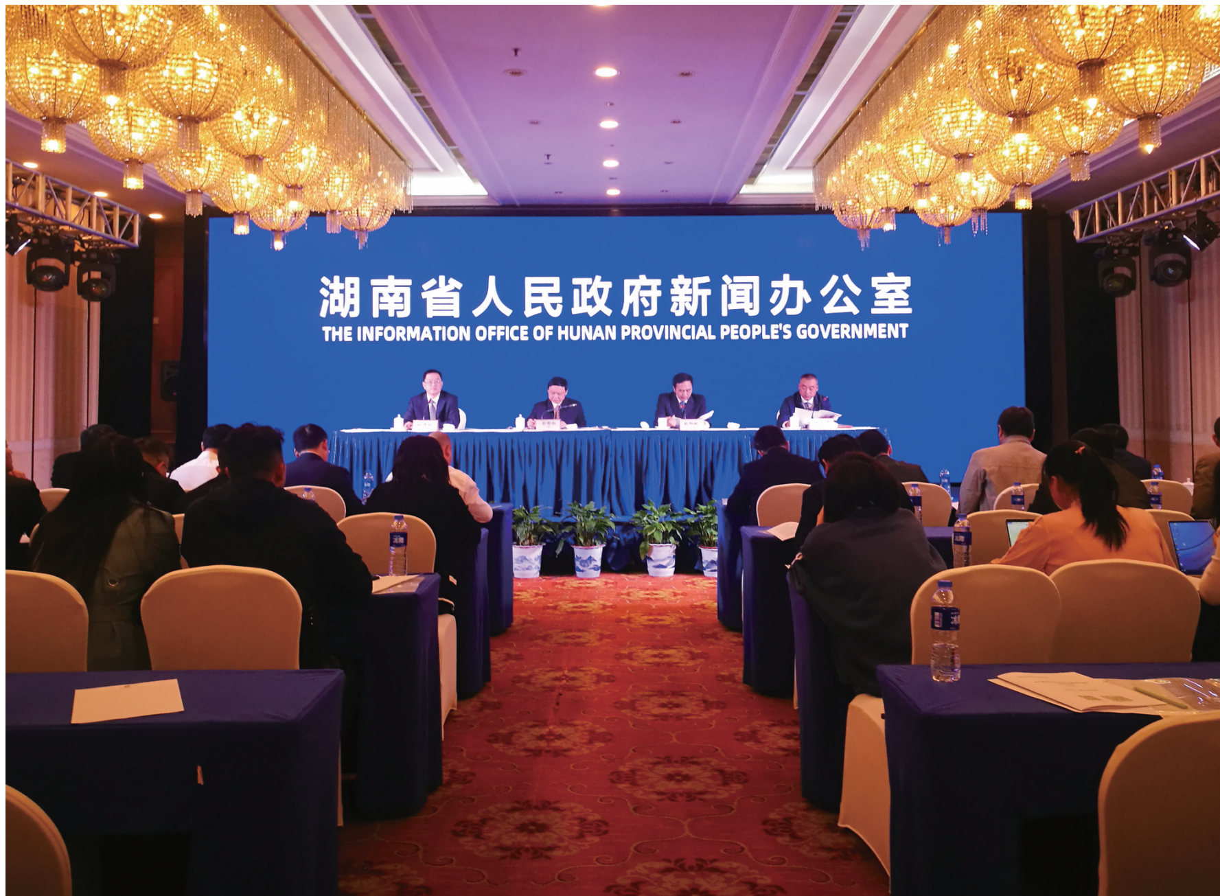
新闻发布会现场

本报长沙电 10月25日，2019湖南红色旅游文化节暨桑植民歌节新闻发布会在长沙举行，向全球发出邀约：2019湖南红色旅游文化节暨桑植民歌节将于11月19日开幕，1+7主题活动精彩不断，请到湖南桑植来。