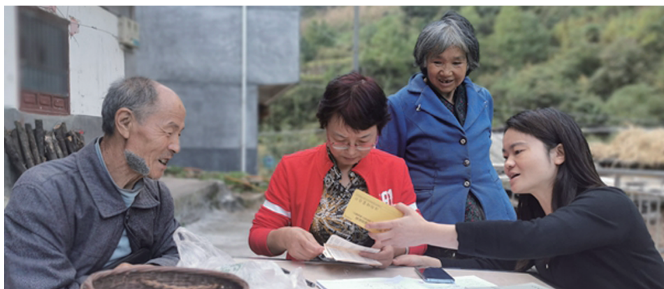
近日，陕西省安康市汉滨区纪委监委干部深入贫困村，全面排查农村危房改造项目资金管理使用问题线索。

市纪委监委举报电话：12388 永定区纪委监委举报电话：8596313 武陵源区纪委监委举报电话： 5611728 慈利县纪委监委举报电话：3231320 桑植县纪委监委举报电话：6223166