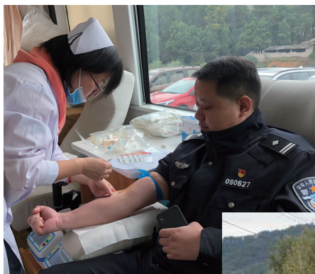
▲10月23日上午，市公安局交警支队直属一大队举行无偿献血活动，共计37名民警和协辅警踊跃参与。

▼10月22日，桑植县八斗溪桥拆除重建工程项目正稳步推进，项目施工方正抢抓有利天气加紧施工。新桥预计将在11月15日建设完成，11月26日实现通车。