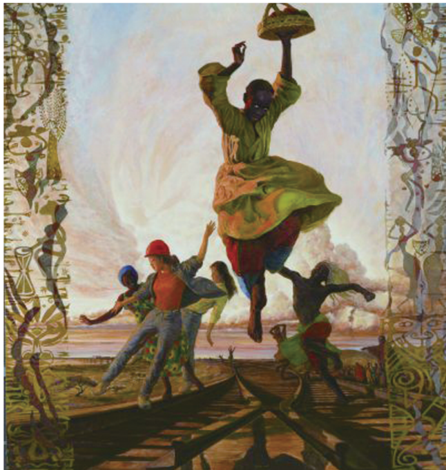
情满阿非利加(油画) 140 130厘米 王沂光

从西方引进的油画在我国也得到了很大发展，美术院校逐渐建立和完善了油画教学体系，培养了大批油画人才。50年代中期，杰出油画家、《开国大典》和《春到西藏》的作者董希文，提出油画民族化的主张，建议艺