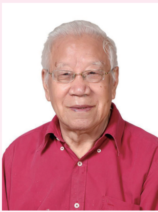
卫兴华 人民教育家

于漪，女，汉族，中共党员，1929年2月生，江苏镇江人，上海市杨浦高级中学名誉校长，曾任全国语言学会理事、全国中学语文教学研究会副会长。她长期躬耕于中学语文教学事业，坚持教书育人，推动“人文性”写入全国《语文课程标准》。主张教育思想和教学实践同步创新，撰写数百万字教育著述，许多重要观点被教育部门采纳，为推动全国基础教育改革发展作出突出贡献。荣获“全国三八红旗手”“全国先进工作者”“改革先锋”等称号。