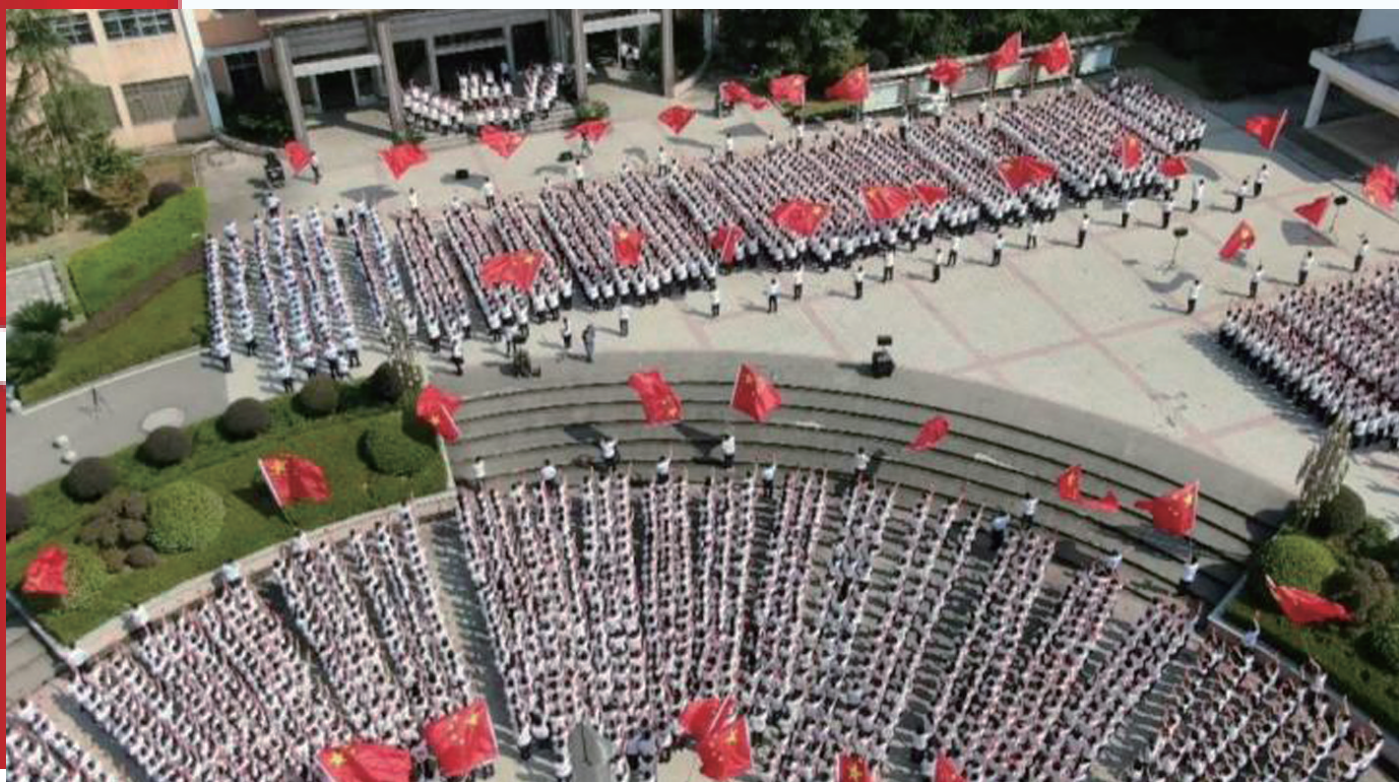
►国庆前夕，桑植一中全体师生合唱《歌唱祖国》，表达对祖国的热爱和祝福。