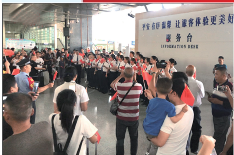
▲9月30日下午，张家界火车站举行国庆“音乐快闪”活动，车站工作人员与旅客一齐唱响歌唱祖国，共祝祖国母亲生日快乐。