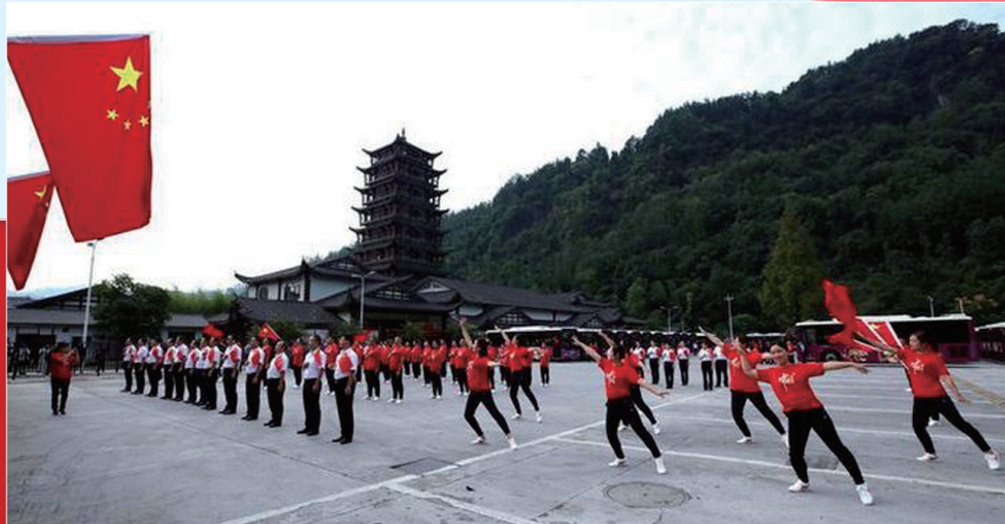
▲10月1日上午，张家界易程天下环保客运有限公司在武陵源核心景区标志门广场站、森林公园站及天下第一桥站分别上演《礼赞新中国》《奋进新时代》大型快闪活动，庆祝中华人民共和国成立70周年。

九月以来，张家界各行各业广泛开展庆祝新中国成立70周年活动。从景区到市区，从机关到社团，从医院到学校，从社区到乡村，大家以饱满的热情歌颂和赞美伟大的祖国和伟大的共产党，抒发对新时代幸福生活的真挚感受，为新中国成立70周年献上美好祝福。