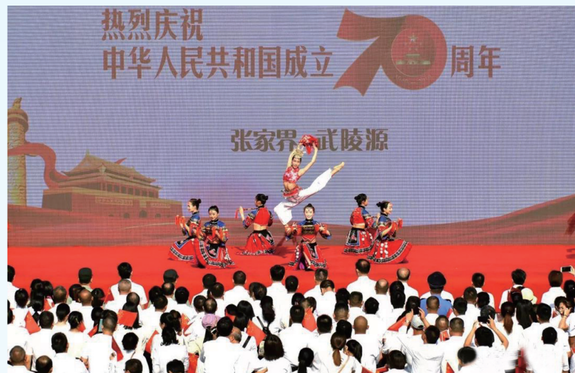
▲10月1日，武陵源区数千名干部职工和游客同唱《我爱你中国》《我和我的祖国》《今天是你的生日，我的中国》等经典爱国曲目，抒发对祖国的热爱。