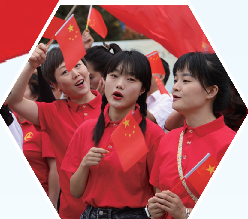
▲近日，慈利县举行《我和我的祖国》快闪活动，大家纷纷表白祖国，祝福祖国繁荣昌盛。