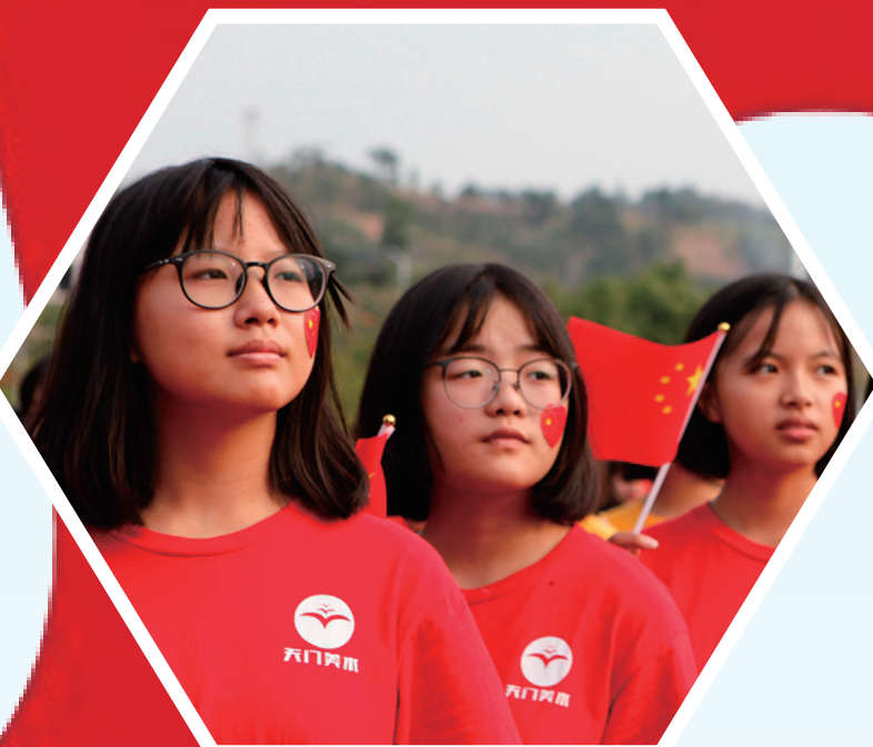
▲10月1日上午，天门中学举行“爱我中华，献礼祖国”育德活动。图为天门中学学生对国旗行注目礼。