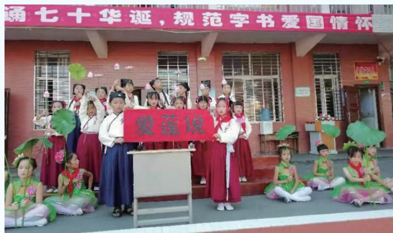
▲9月30日，永定区二家河完小举行“普通话诵70华诞、规范字书爱国情怀”主题经典诵读活动。师生们通过朗诵经典爱国诗文，歌颂祖国70年新变化。