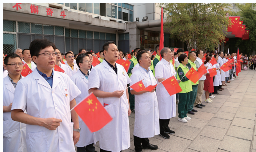
▲10月1日，市人民医院举行升旗仪式暨“旅游医生”志愿者出征仪式，全体人员齐唱《歌唱祖国》。