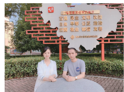
生产经营办工作人员合影