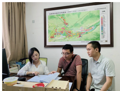
与甲方沟通工作合影

生产经营管理办按照 运转有序、协调有力、督办有效、服务第一 的标准，充分履行职责，发挥助手 作用，积极开拓业务，深化规范管理，强化工作协作，搭建优质服务平台，助推张家界市规划设计研究院的跨越式发展。