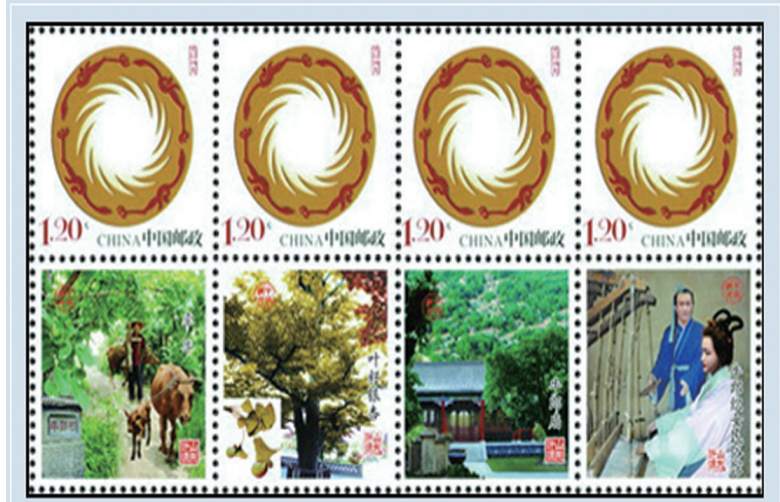
中国邮政发行的“牛郎织女”个性化邮票

牛郎织女的爱情故事，在我国民间广为流传，家喻户晓。2002年10月26日，中国邮政发行了《民间传说 董永与七仙女》特种邮票一套5枚，图案分别为 孝心感天 下凡结缘 织锦赎身 满工还家 天地同心。2008年8月7日（七夕节），中国邮政发行了《牛郎织女》个性化邮票一套8枚。邮票主图为中国文化遗产标志 太阳神鸟。附票为牛郎织女风景名胜区图，附载 牛郎织女 瓦当印记。2010年8月16日（七夕节），中国邮政发行了《民间传说 牛郎织女》特种邮票一套4枚。图案分别为 盗衣结缘 男耕女织 担子追妻 鹊桥相会。邮票采用中国传统剪纸和皮影的艺术风格，将牛郎织女的爱情传说