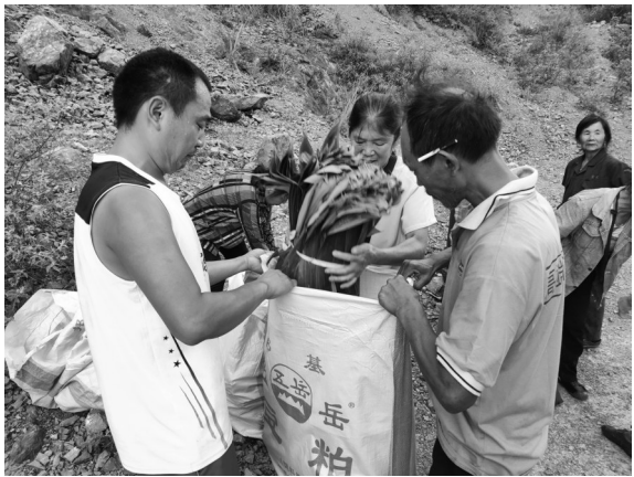
▲合作社成员现场收购新采摘的粽叶。