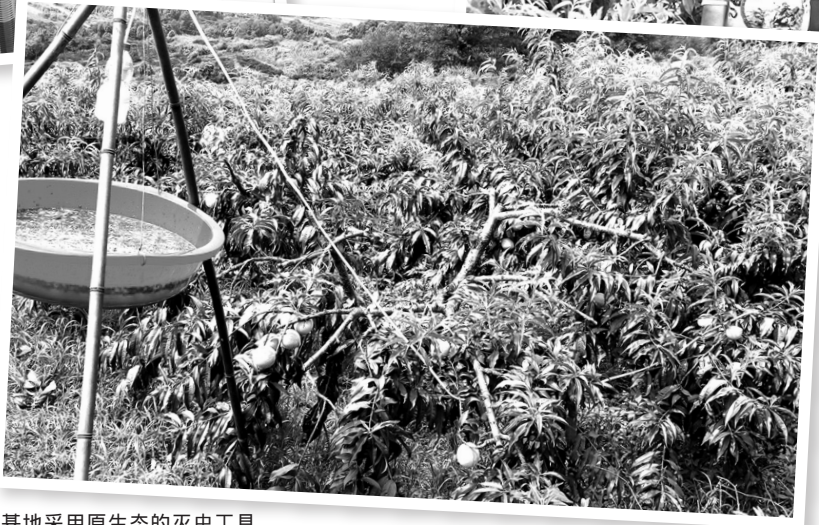
基地采用原生态的灭虫工具。