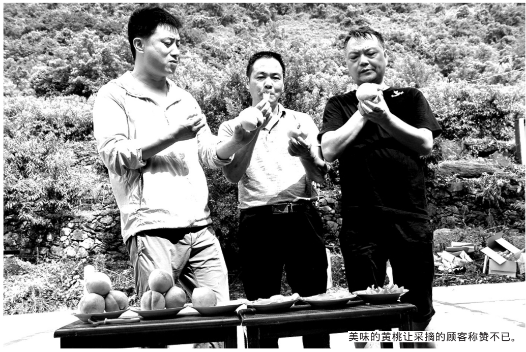
美味的黄桃让采摘的顾客称赞不已。