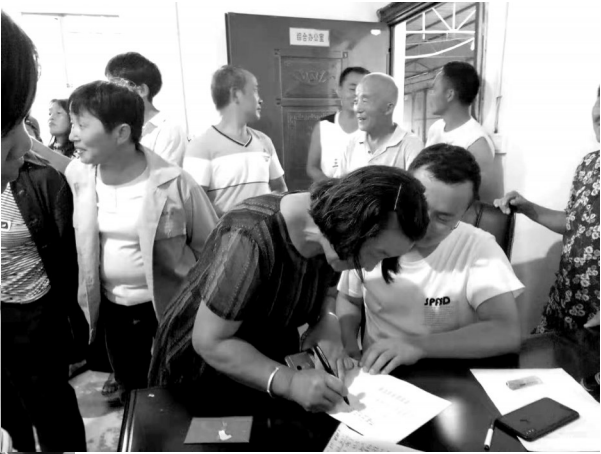
▲农户领取粽叶收购及奖励资金。