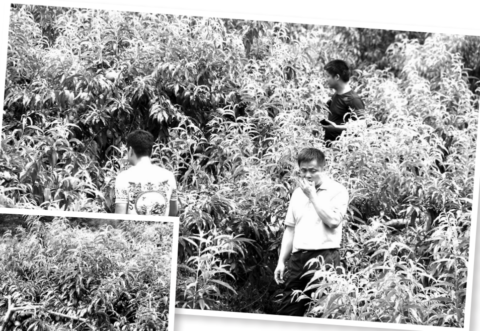
游客穿梭在黄桃园里体验采摘乐趣。