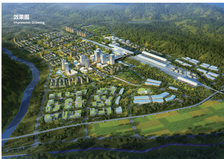
桑植高铁新城城市设计

作为一名规划设计师，要把以人为本作为城市总体规划编制的纲要，牢固树立绿水青山就是金山银山的理念，提高城市承载力、宜居性和包容性，把张家界建设成为人性化的大都市，让人民群众有更多的获得感、幸福感和安全感。