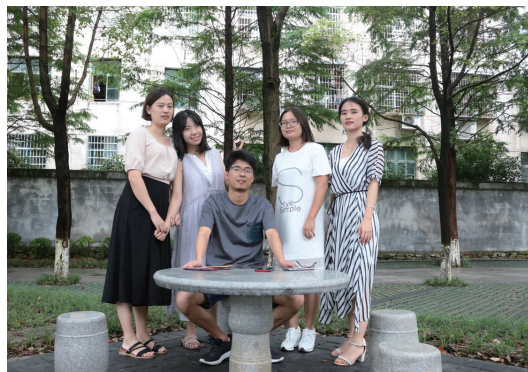
规划研究中心工作人员合影