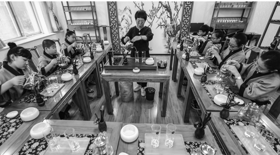
7月17日，孩子们在河北省大厂回族自治县青少年校外活动中心的暑期兴趣特色培训班学习茶艺。

正值暑期，河北省大厂回族自治县青少年校外活动中心举办多彩生活乐享暑假暑期系列公益活动，开设茶艺、绘画、乒乓球等十多个兴趣特色培训班，丰富少年儿童暑期生活。