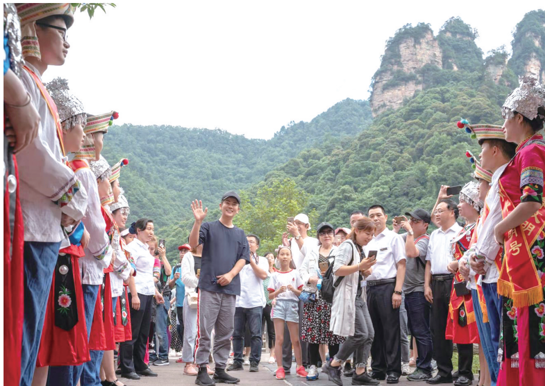
在景区吸引了大批粉丝围观

医 在听完讲解员的讲解之后，也入乡随俗，在 宝峰神女 前默默祈祷并许愿。之后， 宝峰神女 前花船上的工作人员为客人送上了优美的山歌对唱。火辣热烈奔放的情歌，引得 温太医 情不自禁地一展歌喉。