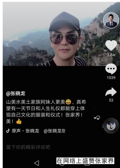
在网上盛赞张家界