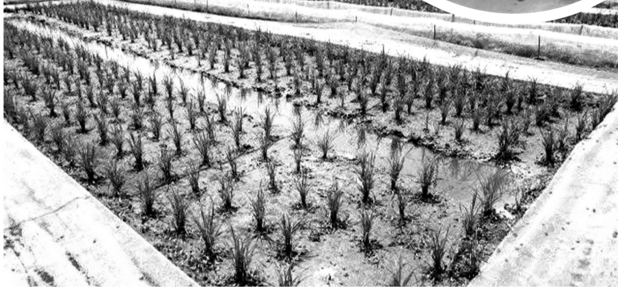
蛙池里的水稻秧苗长势喜人。