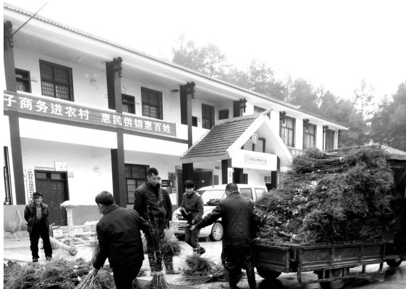
公司为建档立卡贫困户发放杜仲苗。