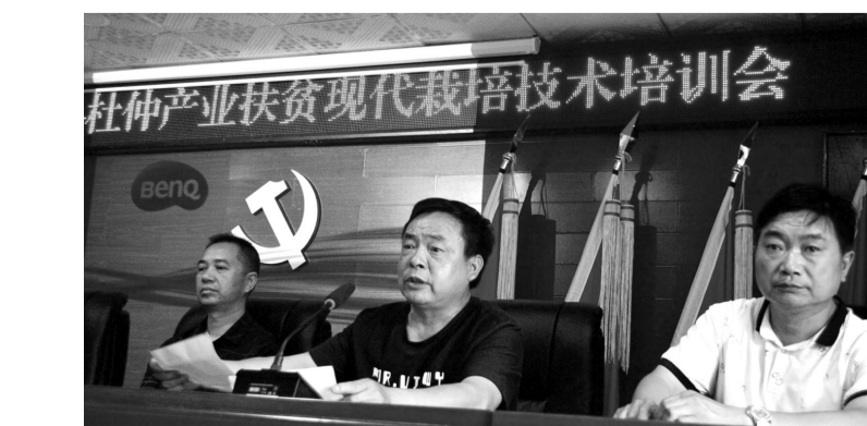
公司负责人为建档立卡贫困户讲解技术要点。

近日，慈利县林业局联合张家界绿春园茶业有限公司举办了杜仲产业扶贫现代栽培技术培训，来自三合镇月亮岩、庄塔村的150多名建档立卡贫困户参加了培训。