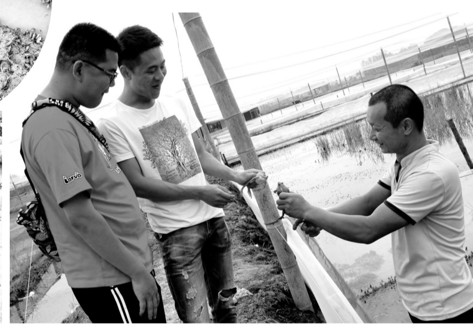
养蛙成功引来客户参观学习。