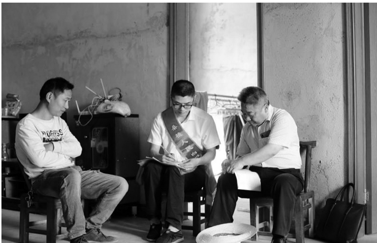
桑植农商银行工作人员入户宣讲扶贫贷款政策。

围绕扶贫小额信贷逾期率不超过1%的考核要求,明确专人做好信息动态监测工作,全面厘清扶贫小额信贷底数,建立分类台账,准确掌握各支行每月到期贷款期限、风险程度、清收成效以及逾期情况。全面贯彻扶贫小额信贷“四个一”工作法,即一月一报告、一月一督查、一月一