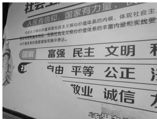
▲市民政局门口公交站台广告牌被损。 ▲市区大庸桥华都国际小区大门口，污水横流，气味难闻。