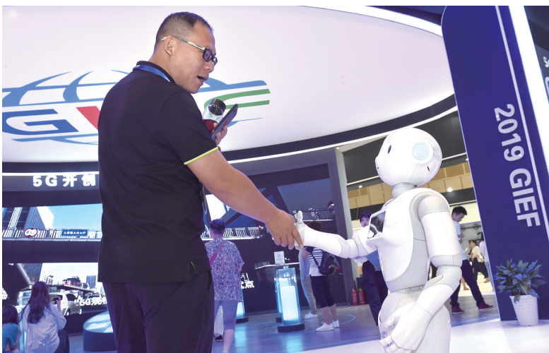
6月11日，一名参观者在与机器人握手。