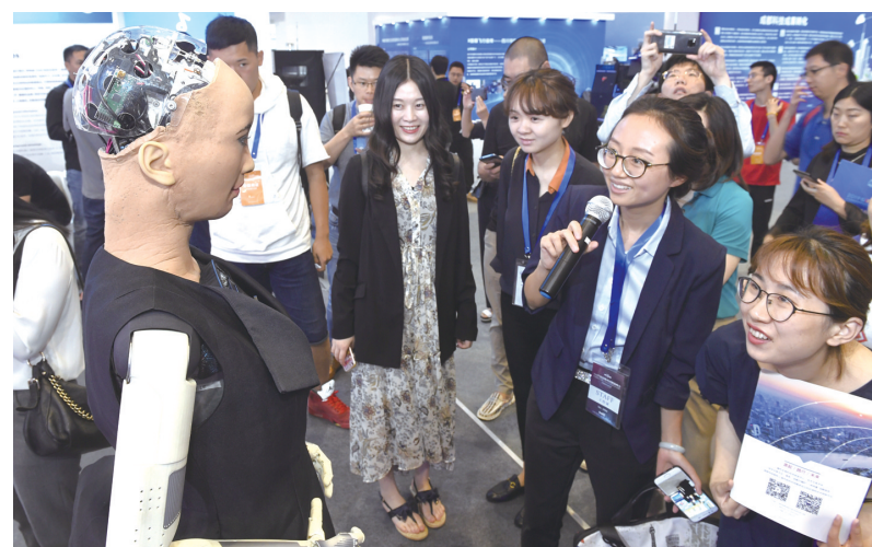
6月11日，参观者在与机器人对话。