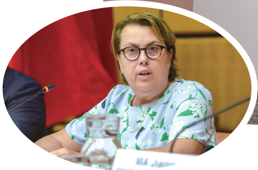
6月11日，在联合国维也纳办事处，联合国外司司长迪皮蓬在 中国古代导航展 从指南针到北斗 开幕式中致辞。