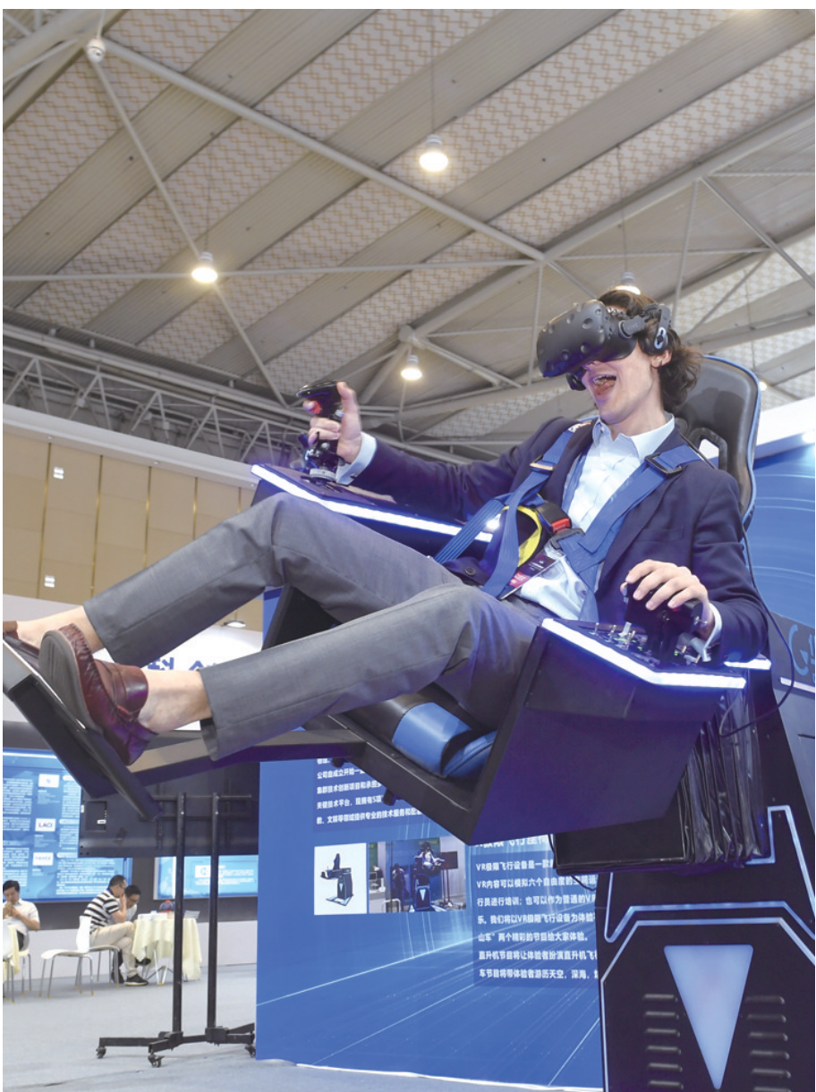
6月11日，一名参观者在体验 极限飞行 座椅。