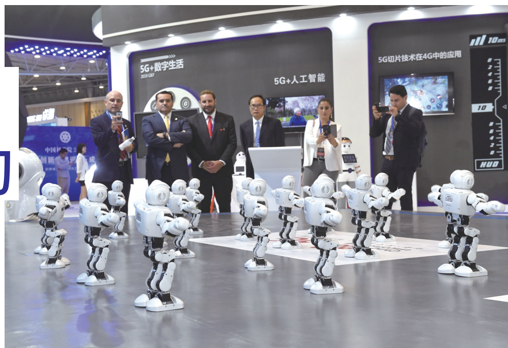
6月11日，观众在观看机器人舞蹈表演。