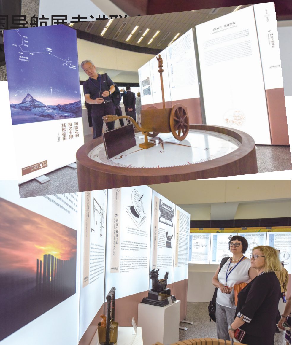
↑ 6月11日，在联合国维也纳办事处，人们参观 中国古代导航展 从指南针到北斗 展览。