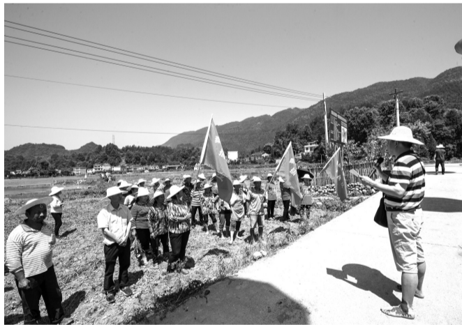
各支插秧队蓄势待发。