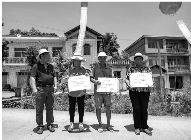
获得胜利的插秧队。