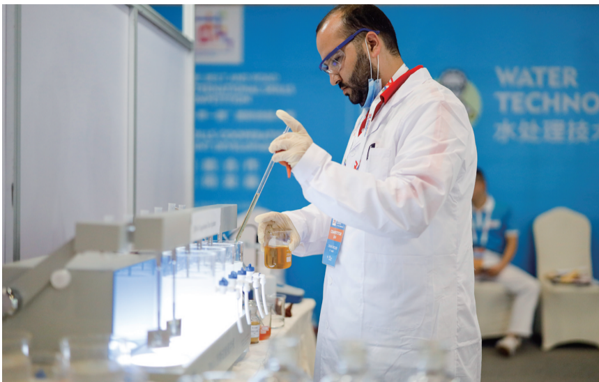
选手参加“一带一路”国际技能大赛水处理技术项目比赛。