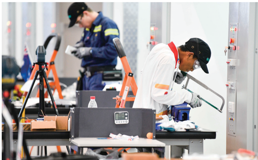
选手参加“一带一路”国际技能大赛电气装置项目比赛。