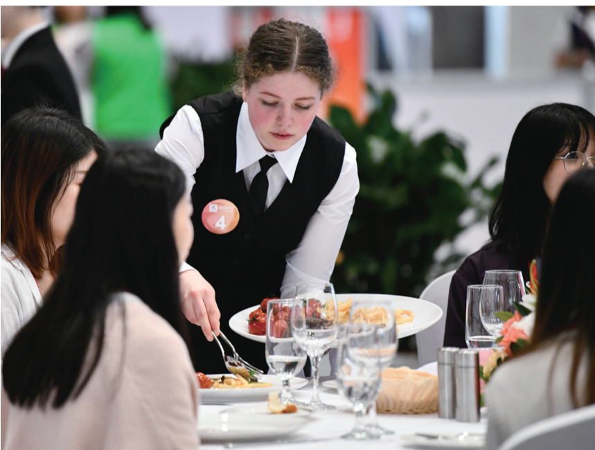
选手参加“一带一路”国际技能大赛餐厅服务项目比赛。