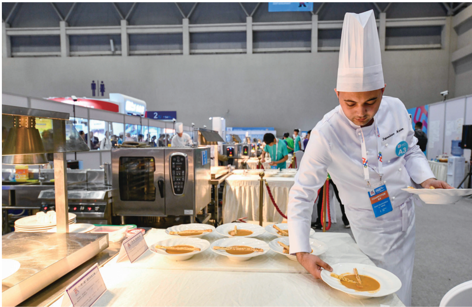
选手参加“一带一路”国际技能大赛烹饪项目比赛。