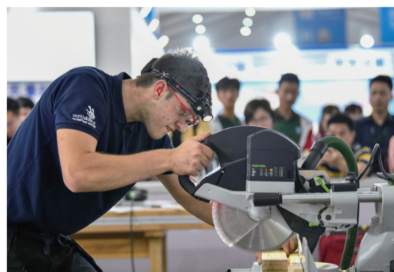
选手参加“一带一路”国际技能大赛精细木工项目比赛。