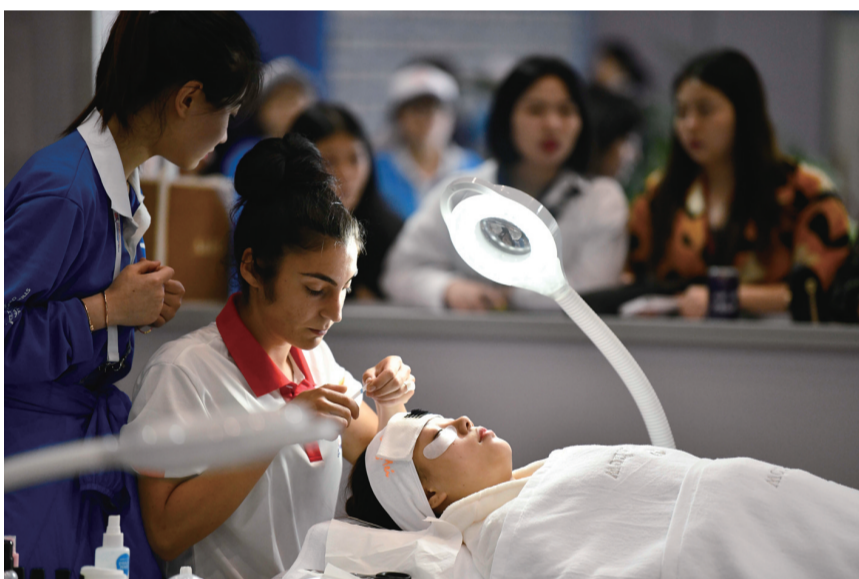
选手参加“一带一路”国际技能大赛美容项目比赛。