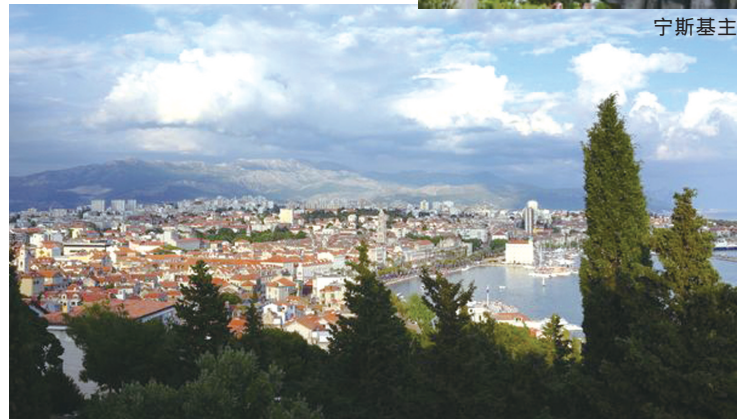
从东边的马丽艳山看斯普利特全貌