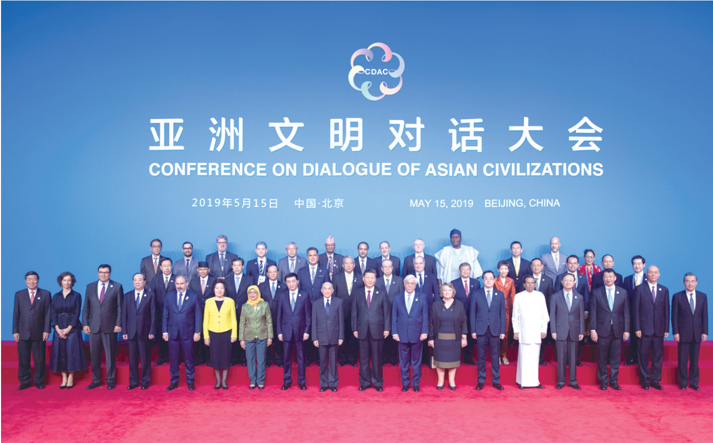
这是开幕式前，中外领导人同出席开幕式的重要嘉宾代表合影留念。

新华社北京5月15日电（记者李忠发、熊争艳、丁小溪）国家主席习近平15日在北京国家会议中心出席亚洲文明对话大会开幕式，并发表题为《深化文明交流互鉴 共建亚洲命运共同体》的主旨演讲，指出璀璨的亚洲文明为世界文明发展史书写了浓墨重彩的篇章。亚洲人民期待一个和平安宁、共同繁荣、开放融通的亚洲。我们应该坚持相互尊重、平等相待，美人之美、美美与共，开放包容、互学