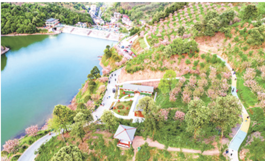
在江西萍乡乡下村 阳光花海 基地,各类花木与秀美的湖光山色交相辉映。