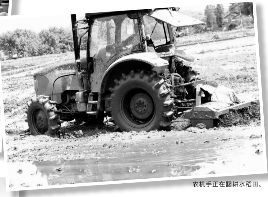
农机手正在翻耕水稻田。