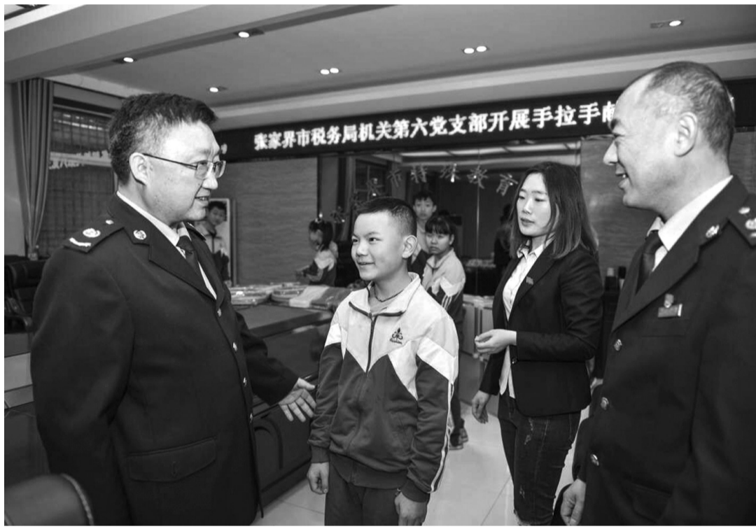
近日，市税务局机关第六党支部开展手拉手助学活动，关爱留守儿童，主题党日活动，组织支部党员和市局机关工委来到市特殊教育学校看望残疾儿童，并为该校捐赠手鼓木琴、电子琴等学习用品共110余件。