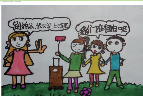
《自拍时代的美丽误会》 吴昀萱 福建