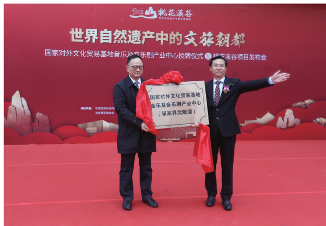
国家对外文化贸易基地音乐及音乐剧产业中心(张家界武陵源)授牌

习近平总书记指出,要推动文化产业高质量发展,培育新型文化业态和文化消费模式,以高质量文化供给增强人们的文化获得感、幸福感。省委省政府也表示,未来几年,湖南将充分利用文化旅游业开放性、国际化的特点,发挥湖南“一带一部”区位优势,对接国家“一带一路”战略,大力实施“锦绣潇湘”文旅品牌建设工程,深入开展“锦绣潇湘”走进“一带一路”文化旅游合作交流系列活动,推动我省入境旅游发展迈上新台阶。张家界市委市政府深入贯彻落实中央、省委精神,持续推进文化强市建设,启动旅游地区文化新引擎,坚决实施“文化+”行动,推进文化与旅游、农业、康养等产业深度融合,延伸产业链,提高产业附加值,形成了“文化+旅游”的文旅产业融合发展之路。