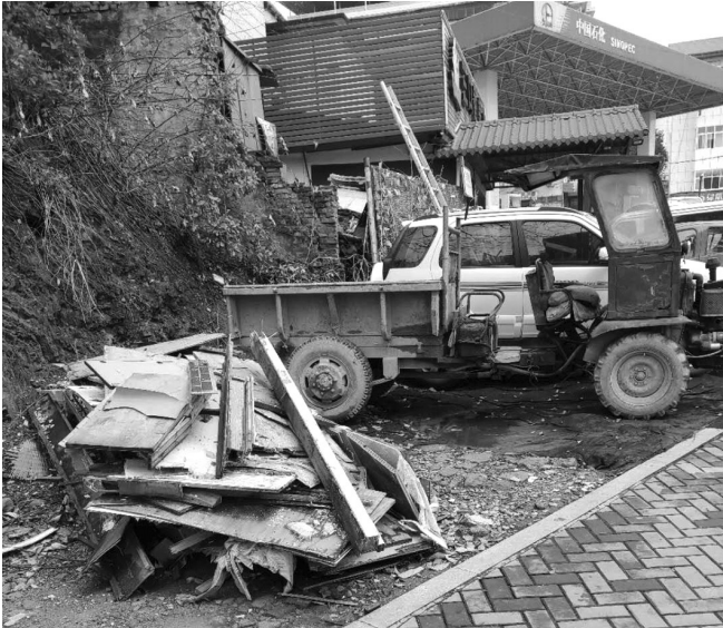
永定区三角坪加油站旁一片乱乱。