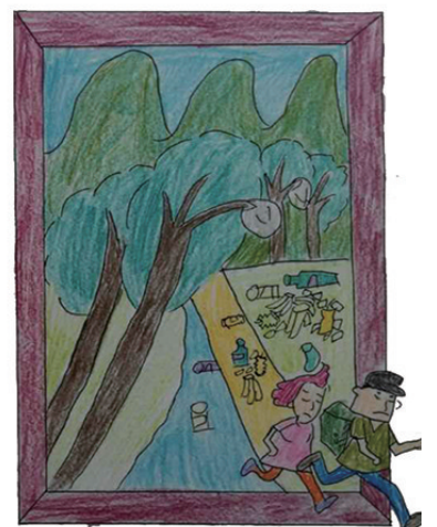
《人走之后》 韩艳慧 (山东)