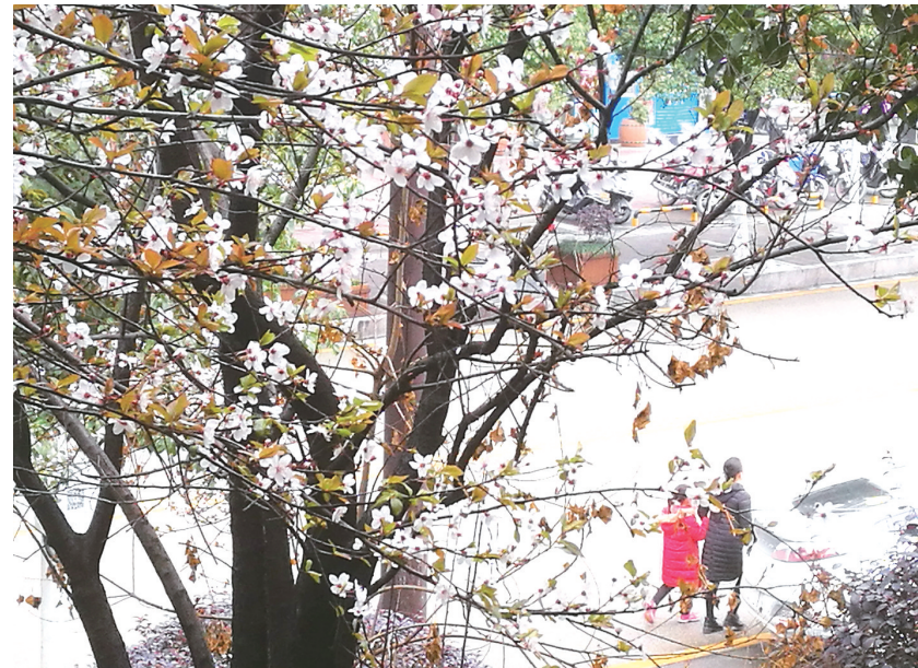
3月19日,一对母女从盛开鲜花的树下走过。连日来,天气晴好,市城区各类鲜花竞相开放。

目前,湖南省植保植检站已将柑橘沙皮病列为重点防控对象。为有效控制柑橘沙皮病的危害,增加果农收益,永定区将进一步加强防控技术研究,并继续开展试验示范,不断完善技术措施,全面推动柑橘沙皮病绿色防控示范工作。(本报记者 陈硕)