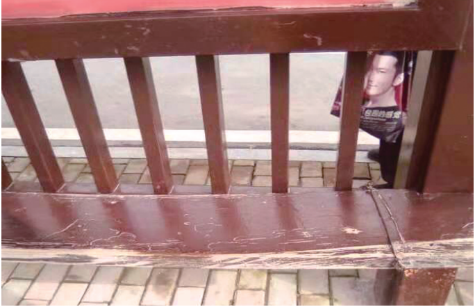
永定区人民检察院门前公交站台的坐板损坏。