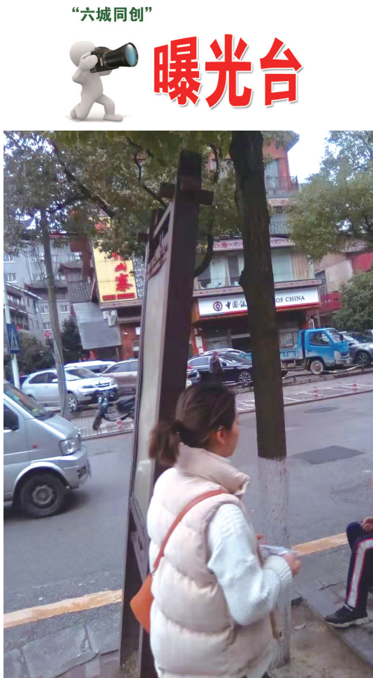
市人民医院门前的公交站台道路提示牌倾斜。

本报讯 3月17日,桑植县诗词楹联协会成立。桑植县诗词楹联协会系群众性民间文学艺术团体,属非营利性社团组织,其宗旨是团结力量,多出精品,规范诗词行为,繁荣文化事业。(黎治国)