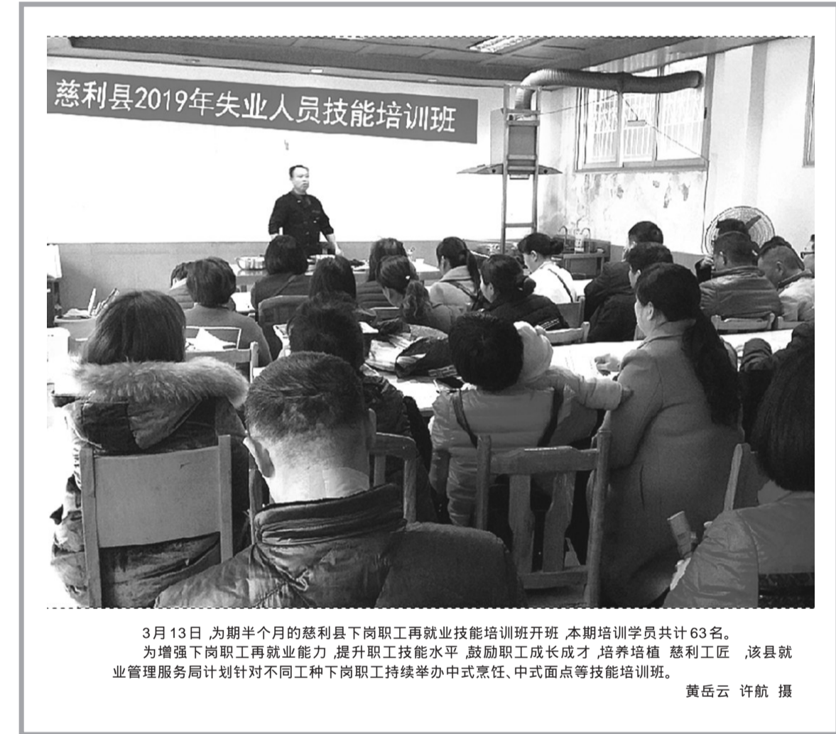
3月13日,为期半个月的慈利县下岗职工再就业技能培训班开班,本期培训学员共计63名。为增强下岗职工再就业能力,提升职工技能水平,鼓励职工成长成才,培养培植慈利工匠,该县就业管理服务局计划针对不同工种下岗职工持续举办中式烹饪、中式面点等技能培训。