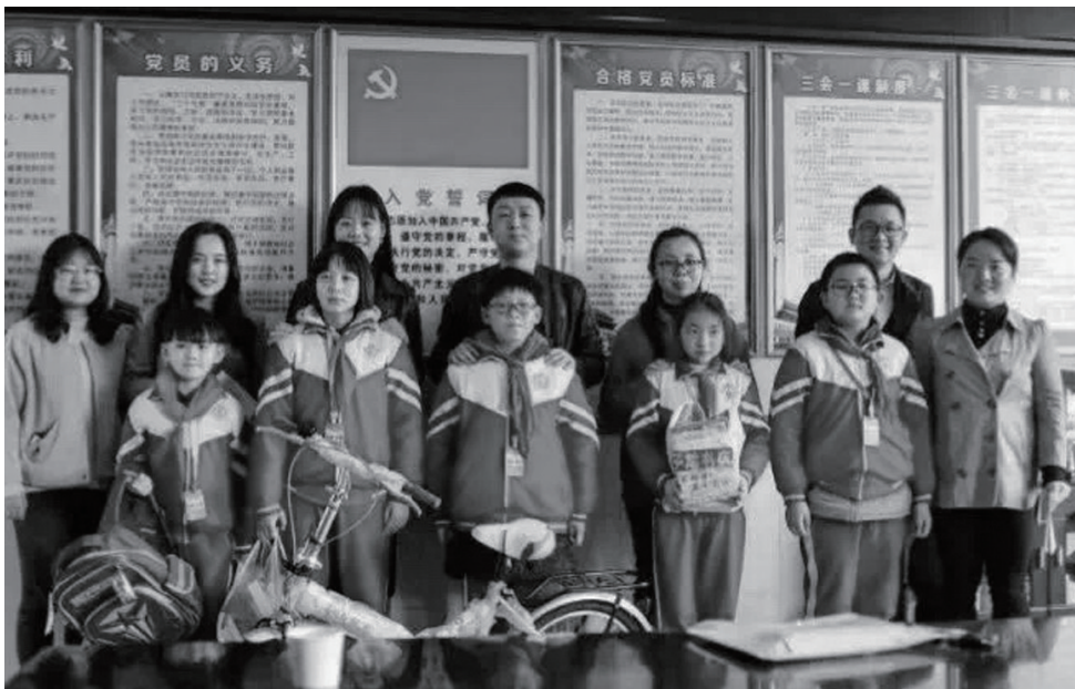
▲为金慈实验小学5名学生送来2018年度花儿朵朵助学金和微心愿礼物