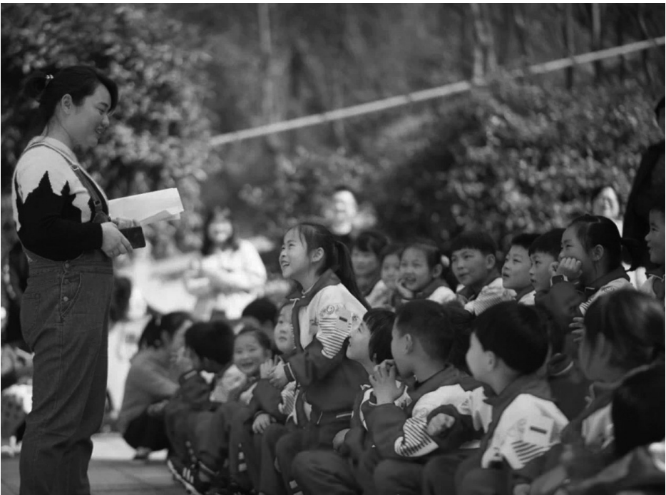
▲为少先队员讲主题团课