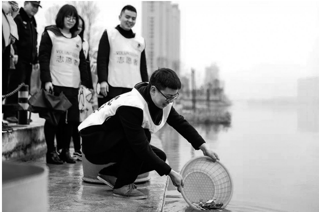
▲到澧水河畔开展 以水养鱼，以鱼治水 放生活动

3月，总有一种炽热的情愫在弥漫；3月，总有一种深切的怀念在升华。在这春风荡漾的3月，慈利县启动了 弘扬雷锋精神 共筑幸福慈利 学雷锋志愿服务活动。之后，团县委积极组织全县各级团委开展活动，以实际行动弘扬雷锋精神，践行志愿服务理念，让 志愿 红色鲜花竞相绽放。