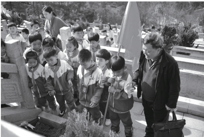
▲到烈士陵园进行爱国主义教育