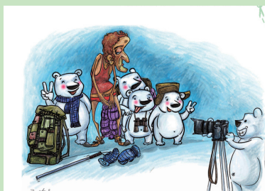
《被合影》 步无方 北京