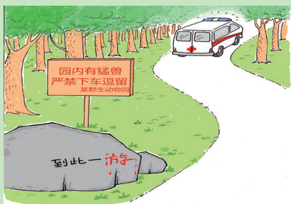
《血的教训》 姬大利 陕西