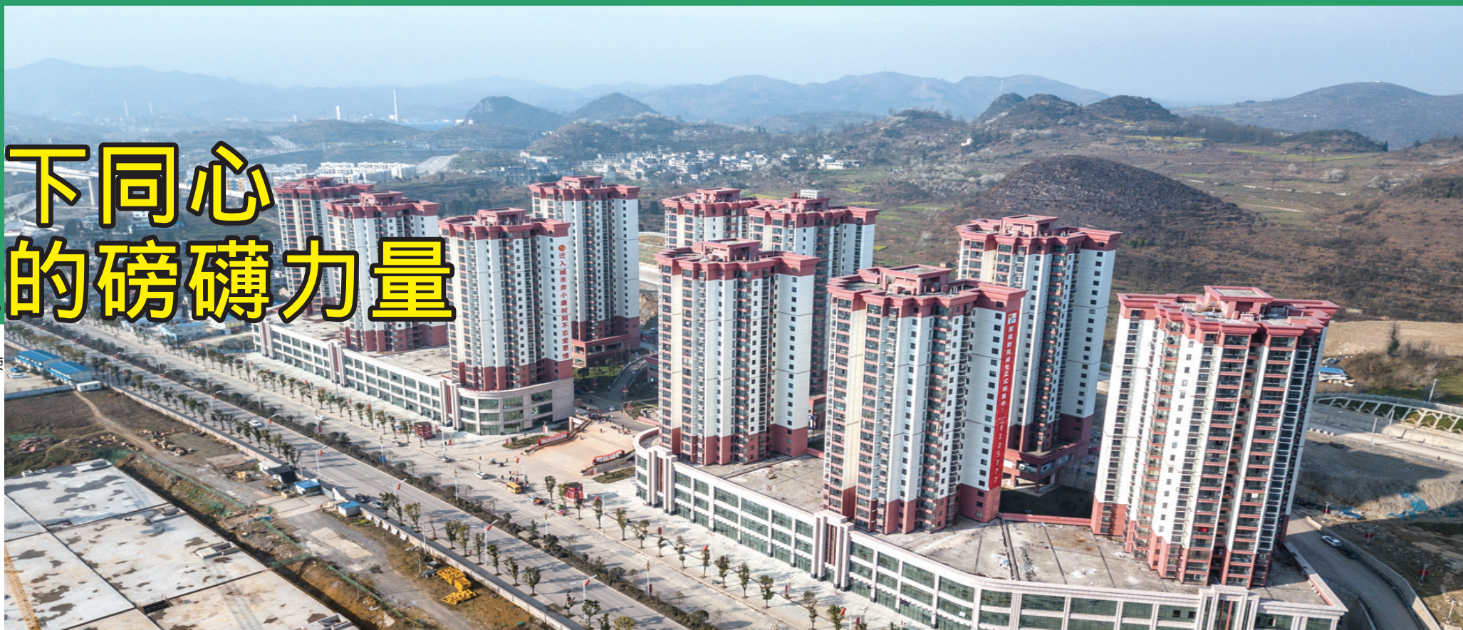
贵州省六盘水市六枝特区的一处易地扶贫搬迁安置小区。

春回大地，万物萌放。 告别极不平凡的2018年， 踏进机遇与挑战并存的2019年， 全国人大代表、全国政协委员齐聚北京。 带着职责使命，观大势、 看全局，攻坚克难的信心与共识正在凝聚。 肩负人民期待，谋良策、 出实招，奋发有为的信念与力量正在奔涌。