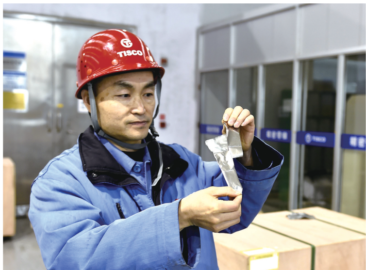
太钢精密带钢公司员工展示“手撕钢”。