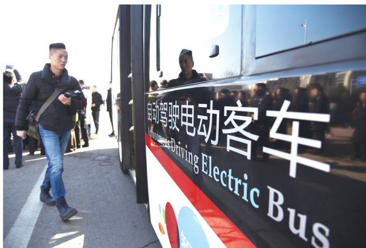
在山东省济南市，一名男子登上无人驾驶汽车，感受无人驾驶技术。