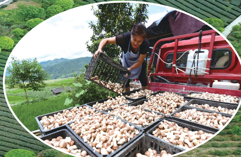
贵州省丹寨县排调镇也改村村民在转运松茸，准备供应市场。