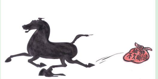
《轻装上阵》 蓝波 四川