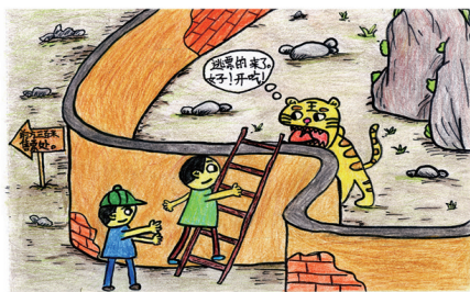
《逃票》 许正阳 安徽