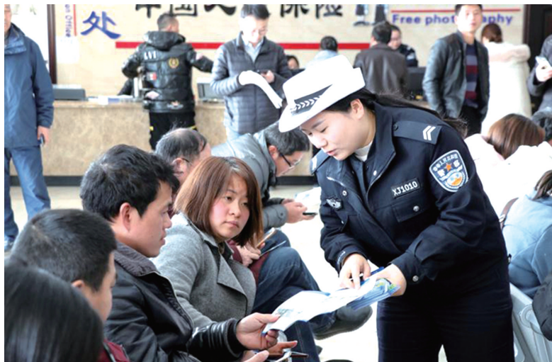
脚架提醒过往车辆避让，并迅速撤离到安全区域协商或等待救援，避免受到二次伤害。（赵前进 王四清）

民警提醒说，一旦发生道路交通事故，行人切记不要靠前围观，驾乘人员要按照相关规定摆放好三