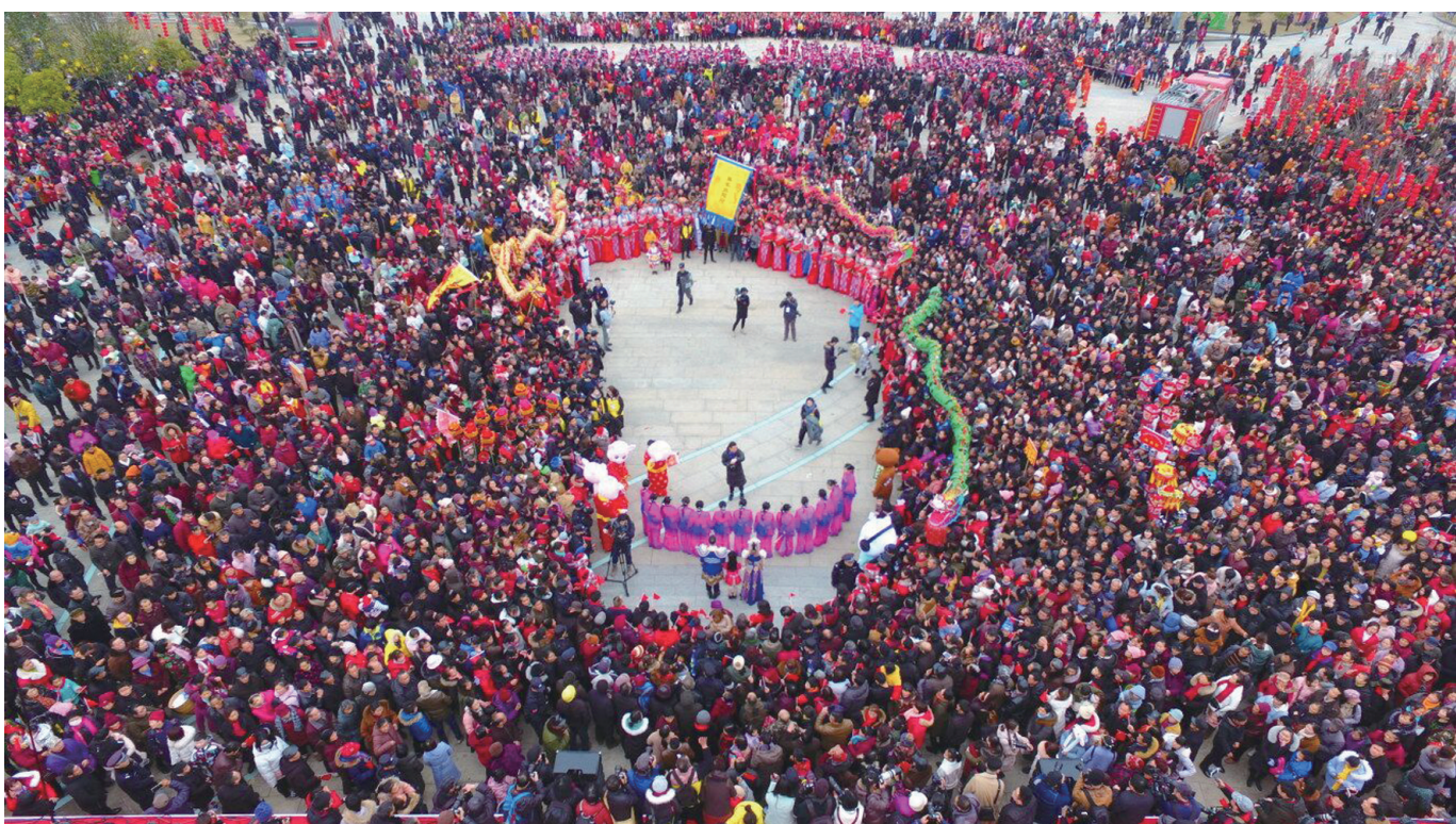
2月19日上午，2019年元宵灯会在市民广场盛大开幕。

报讯 天门盛装庆佳节,澧县闹元宵。2月19日,市民广场灯火喧天,热闹非凡,2019张家界灯会在此盛大开幕,100多支灯队同城竞技,与近30万游客一道激情狂欢。 会上精彩纷呈,台下车水马龙的开幕式结束后,来自市片区的各支少数民族队伍开始沿街巡游和打擂竞技。灯队队伍中,邹家坎、莫家岗灯舞得神采飞扬,烽火村非遗项目草狮子跳得活灵活现,如银花非遗项目高花灯流光溢彩如银河飞舞,曾获湖南