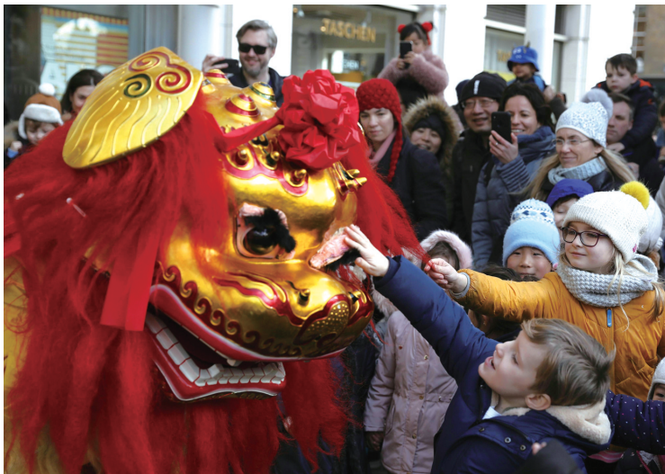
2月9日，在英国伦敦，小朋友与舞狮表演者互动。 当日，伦敦约克公爵广场举行中国农历春节庆祝活动，人们在活动中观看舞狮表演并制作春节装饰品。

春运期间，在我国北方的黑龙江省，高铁列车冒着近零下30摄氏度的风雪严寒，将旅客快捷、平稳地送往目的地。