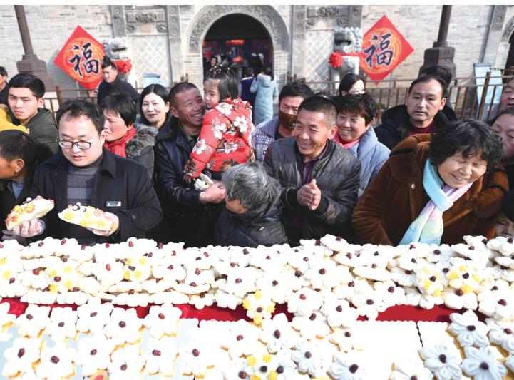
2月5日，在安徽亳州市花戏楼景区山门广场，游客在领取枣花馍。 2月5日是大年初一，安徽省亳州市花戏楼景区开展 游景区 赏民俗 吃枣花馍 活动，1500多个枣花馍 登场亮相，供游客观赏和品尝，营造出浓浓的年味。