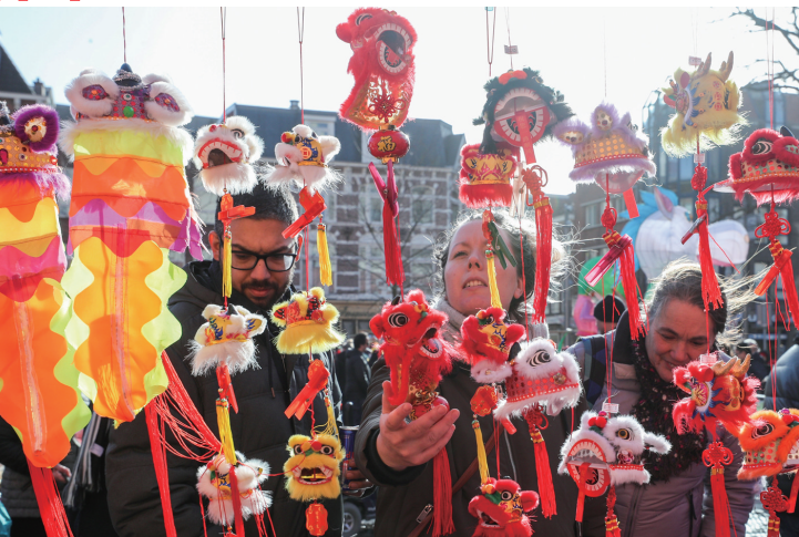
2月9日，在荷兰海牙，民众在庆祝活动中选购中国传统饰品。 当日，海牙中国城、市政厅等地举办活动，庆祝中国农历春节。