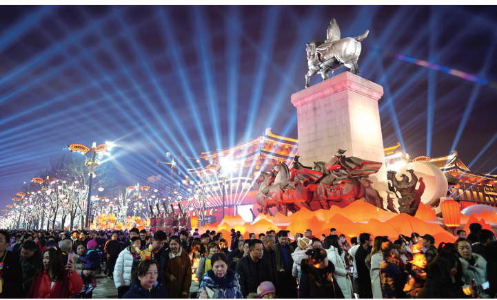
西安市曲江新区大唐不夜城步行街上游人如织（2月5日摄）。 春节期间，古城西安举办丰富多彩的2019 西安年 最中国 系列旅游活动，市内历史文化景区的夜景更令众多游客流连忘返。