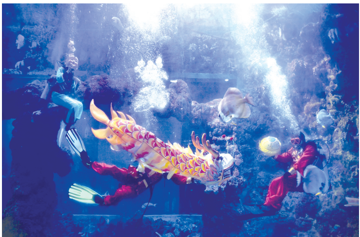
春节期间，青岛海昌极地海洋公园推出 水下舞龙舞狮 表演。潜水员背上氧气瓶，换上演出服装，潜入水下为游客带来 漫游龙宫 神龙摆尾 龙腾狮跃 等耳目一新的表演。