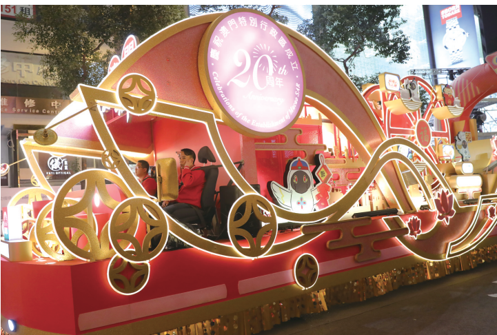
2月5日，一辆花车在香港街头巡游。 当日，香港举行花车巡游，众多演出团队为市民和游客送上新春祝福。