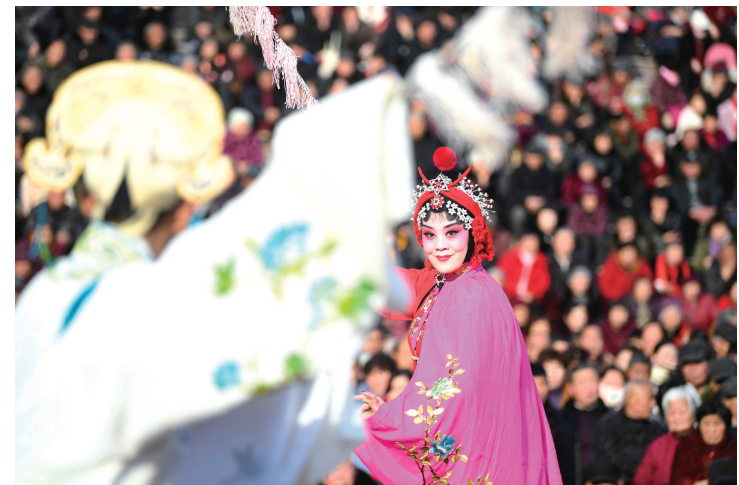
2月5日，在安徽省亳州市魏武广场天幕剧场，演员在表演梆剧《穆桂英挂帅》。 当日是大年初一，安徽省亳州市开展 红红火火过大年 精品戏曲展演活动，让市民在春节期间过足戏瘾，为节日增添喜庆气氛。