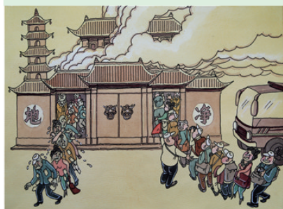
《净地》 江敦生 黑龙江