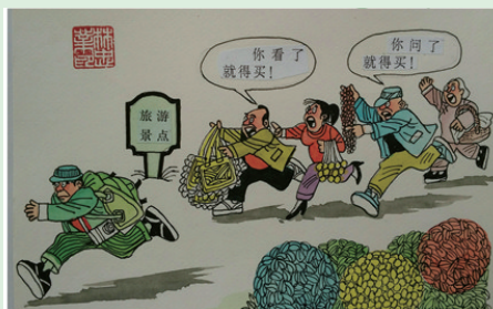
《紧追游客》 林忠业 辽宁