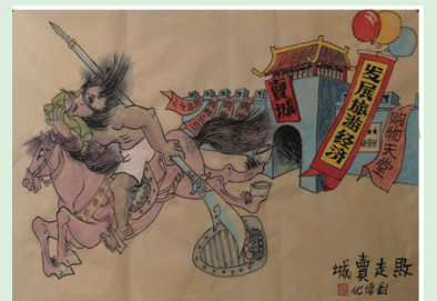
《败走卖城》 刘伟 山西