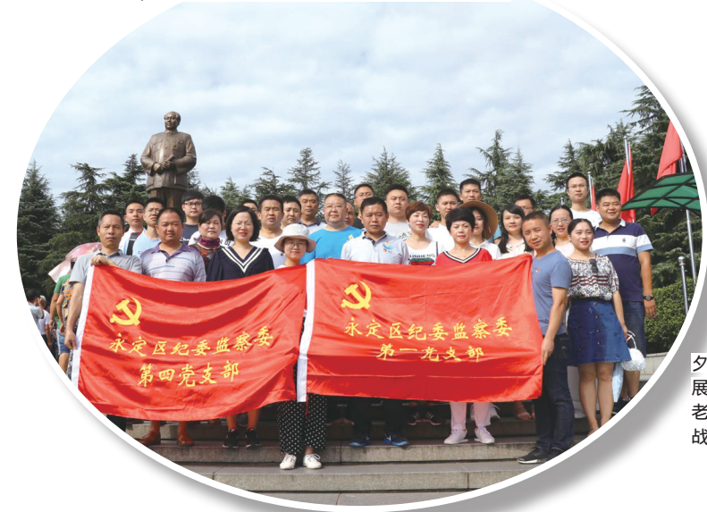
七一前夕，机关支部赴韶山开展主题党日活动，学习老一辈革命先辈浴血奋战，无私奉献的精神