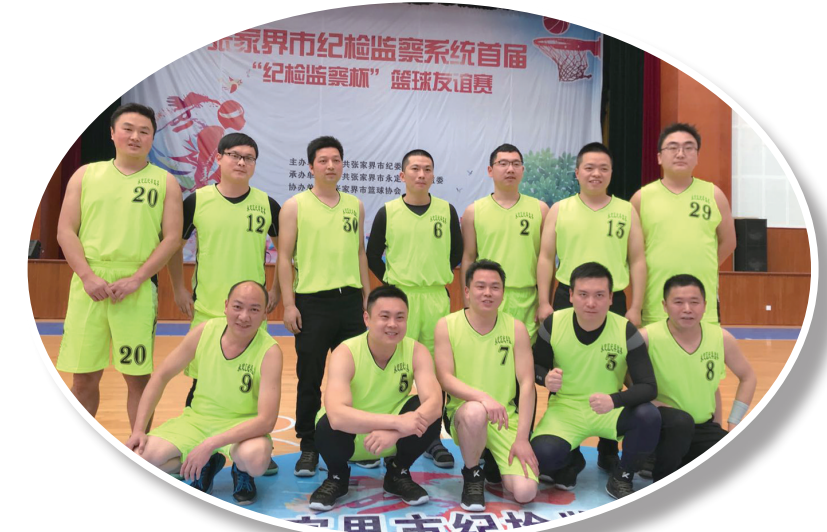
2018年3月9日，两委机关干部参加全市首届纪检监察杯篮球友谊赛，获得男子组冠军