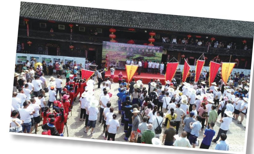
永定区在王家坪镇石堰坪村开展创建好家庭实施好家教传承好家风启动仪式，现场给70多户农户赠送家训牌

光阴荏苒、岁月飞逝。随着2017年12月29日永定区监察委员会正式挂牌运行，从此，永定区纪委、监委这两兄弟相依相随、风雨同舟，每天不知疲倦地打虎拍蝇、反腐倡廉，不断传递浩然正气。回顾这蹒跚学步的一年，我们有太多的话想对大家说。