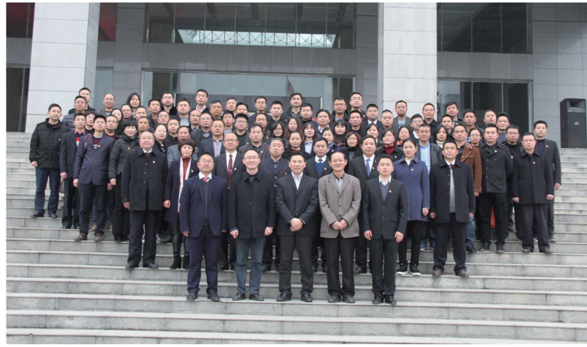
2017年12月29日，区监察委员会成立，两委机关全体纪检监察干部在区纪委监委大楼前合影留念