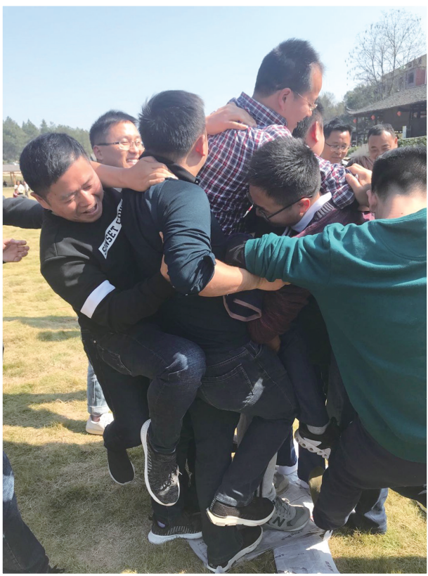
机关工会开展丰富多彩的户外活动，