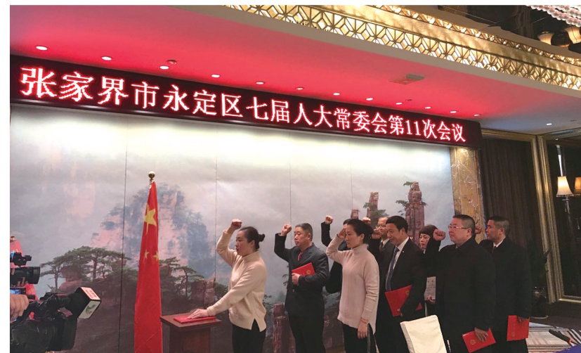
12月22日，永定区第一届监察委员会成员向宪法庄严宣誓