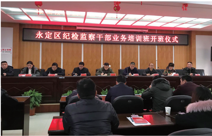
2018年1月18日，为推进纪委监委全面深度融合，形成强大工作合力，全区纪检监察干部进行为期3天的业务培训