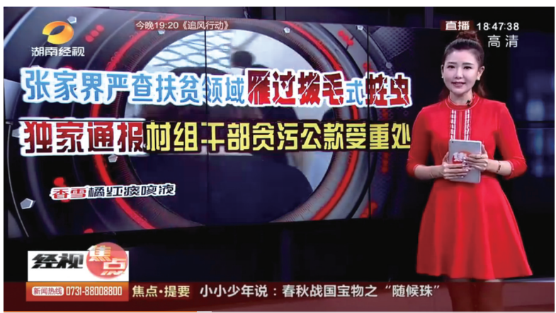
9月12日，《经视大调查》对永定区扶贫领域“雁过拔毛”式腐败问题予以专题报道。