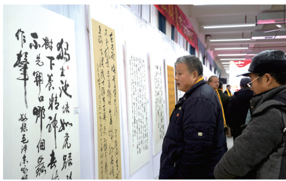
观众欣赏书画展上陈列的作品。