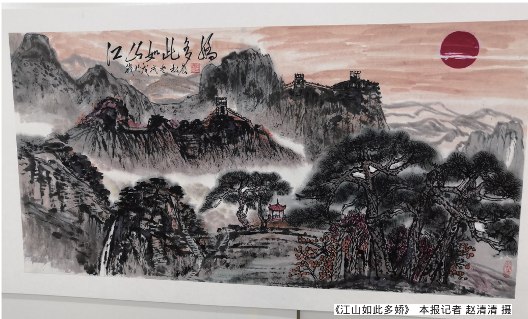
《江山如此多娇》

毛主席的诗词大气豪迈，这些书画作品也着实好看。12月26日，纪念毛泽东诞辰125周年暨著名毛体书画家李松晨书画展上陈列的作品受到了观众们的好评。