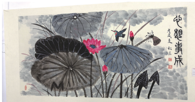
《心想事成》