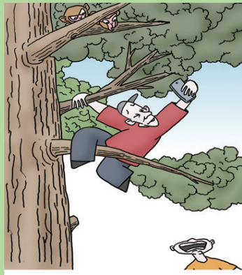
《自愧不知》 尚军 山东