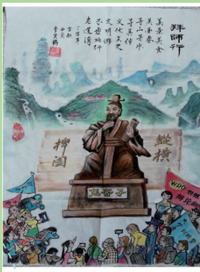
《拜师行》 李笑鹤 陕西