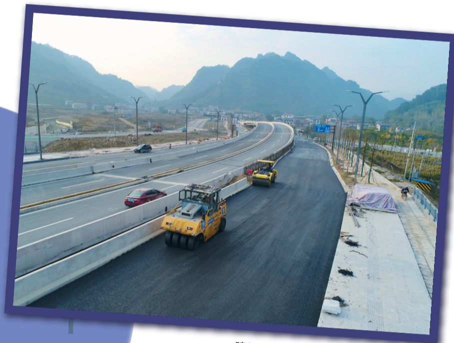
建设中的武陵山大道城区段