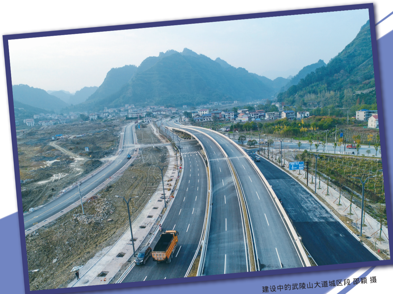
建设中的武陵山大道城区段

可以预见，武陵山大道通车后，从市中心城区到武陵源城区，行车时间大幅缩短，只需二十分钟左右即可，通达性和安全性更是大为提高，交通便捷，旅行的时间成本大幅降低。张家界市中心城区到武陵源城区之间的交流和互补必然发生革命性的变化，张家界旅游提质升级必然加速，旅行者在吃、住、行、娱、游、购六大旅游元素的选择上更加多元、自由和丰富，这无疑是一件令人欢欣鼓舞的事情。