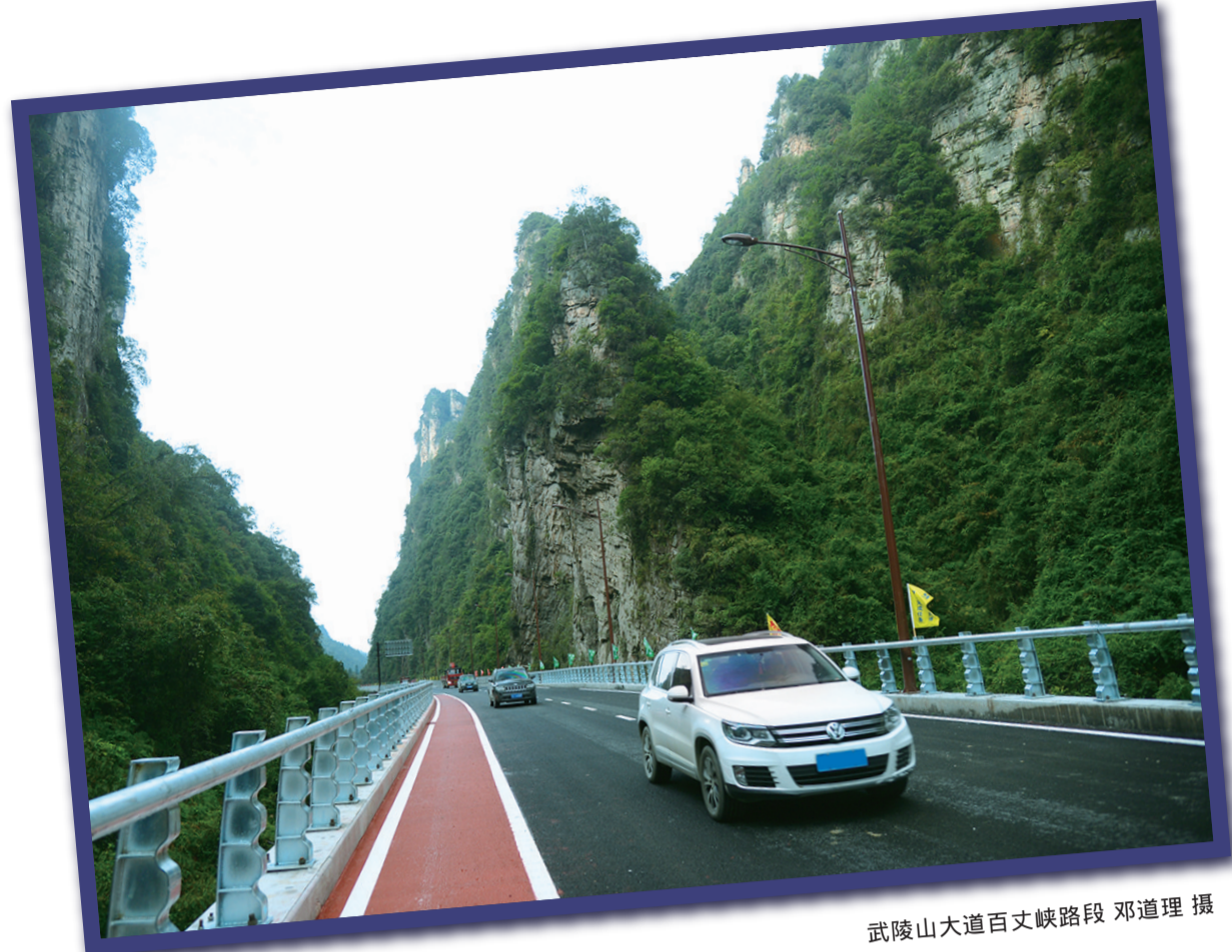
武陵山大道百丈峡路段