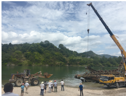
在广岩嘴村拆除河道采砂厂