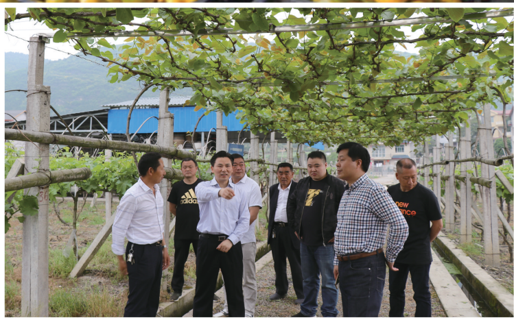
永定区委书记祝云武到后坪社区调研葡萄种植产业

后坪街道位于澧水河南岸，是市城区的西大门，东接市城区，西接湘西自治州永顺县，境内枝柳铁路和省道S306穿境而过，是典型的城乡结合部。去年以来，后坪街道对张罗公路路面进行了全面翻修，对破损老旧的配套设施进行修缮和更换，提升了路面平整度，有效确保了过往车辆的行车安全；安装了446盏太阳能路灯，为群众夜间出行提供了许多便利。