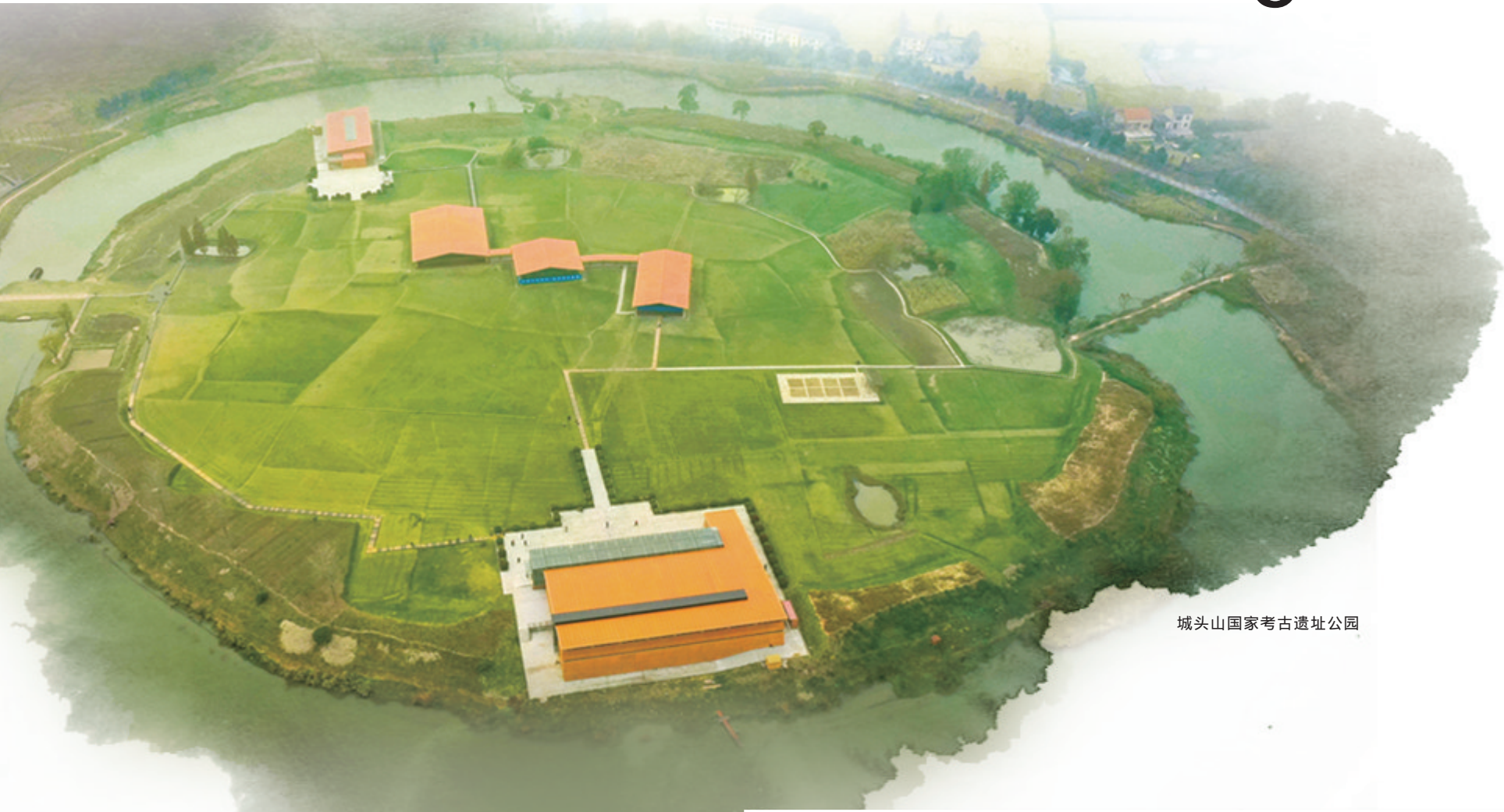
城头山国家考古遗址公园