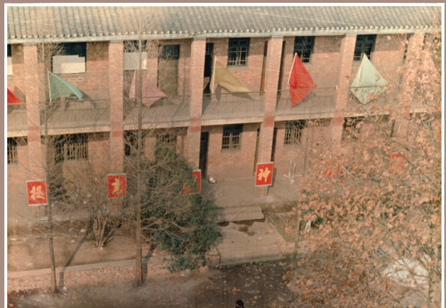
红专楼，此楼全用红砖修建而成，又因历届高三毕业生在此楼考取许多重点大学而得名，修建于1954年，2004年因修建篮球场拆除