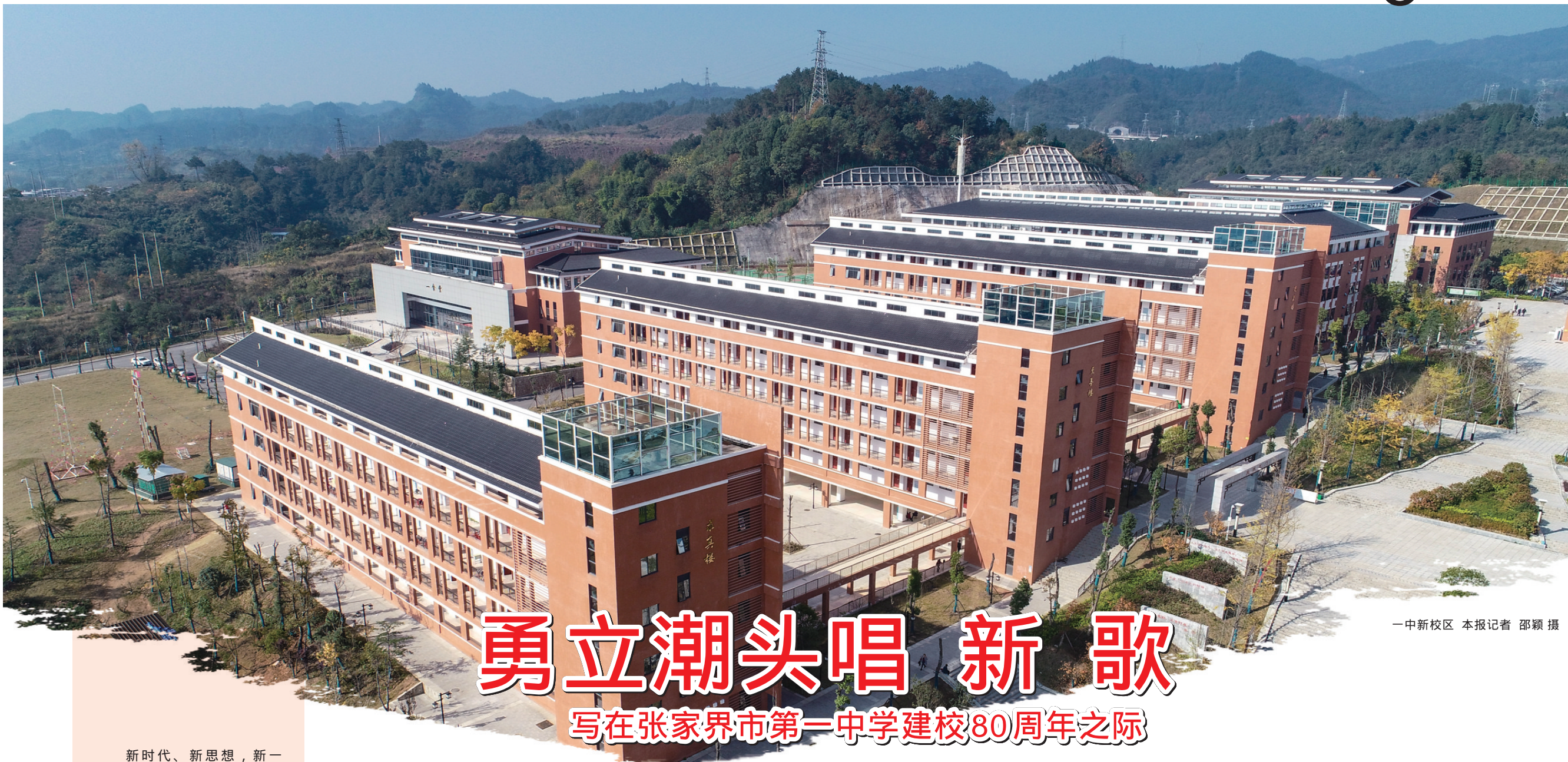
一中新校区