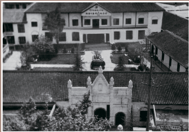
一九三八年创办 湖南省私立孔道中学大庸分校，此为天主堂旧址