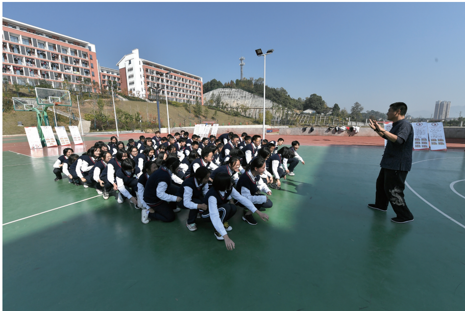
体育课堂