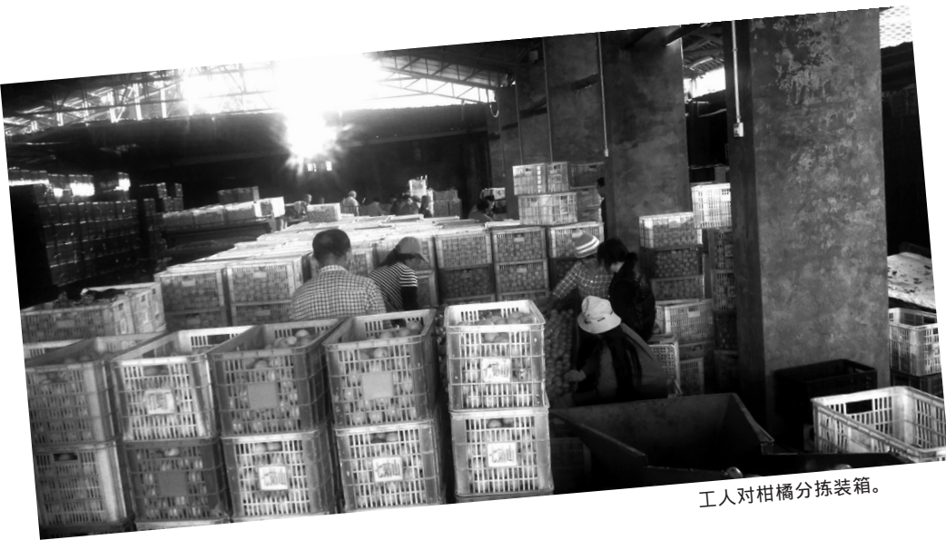
工人对柑橘分拣装箱。