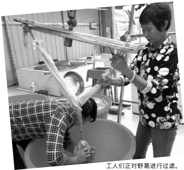
工人们正在对野葛进行过滤。