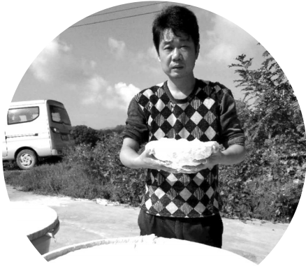
大山的礼物——野生葛粉。