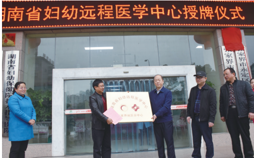
积极探索 空中医疗