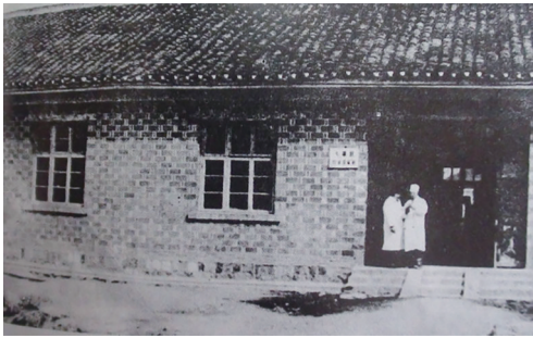
八十年代的 妇幼保健站

1952年6月 成立大庸县人民政府妇幼保健站。 1954年5月 撤销妇幼保健站，在卫生院内设立 妇幼卫生股。 1985年10月 市妇幼保健所动工修建门诊大楼，从此市妇幼保健所有了自己的独立的经营场所。 1987年 搬迁到现址，开始开设临床业务工作。 1988年11月 永定区妇幼保健站更名为永定区妇幼保健所。 1994年 永定区妇幼保健所组织各科室技术骨干8名去津市妇幼保健院参观学习 爱婴医院 创建经验，拉开了我区创建爱婴医院序幕。 1995年9月 获湖南省首批 爱婴医院 荣誉。 1996年 被国家批准为 1996-2000年中国-联合国儿童基金会 妇幼卫生合作项目实施单位。 1997年 妇保院兴建五层住院大楼，门诊部、住院部初具规模，设置了分娩室、手术室、母婴室、生化室，床位增至80张，各种设备不断完善。 1998年 更名为 张家界市永定区妇幼保健院，院内设有行政管理后勤科、保健外勤科、门诊部、住院部。 1999年11月 新住院大楼实施第一例剖宫产手术。 2000年3月 妇幼保健院举行住院大楼落成庆典。 2000年 湖南省卫生厅准许本院开展辖区内的涉外婚前医学检查工作。 2001年 张家界市永定区妇幼保健院是我市当前一所初具规模的，能独立进行妇幼卫生保健与临床诊疗工作的妇幼保健机构。 2002年 成为湖南省儿童医院张家界分院。 2004年9月 医院门诊购进了全市第一台四维彩超。 2006年 层流手术室建成投入使用。 2006年 建成全市第一家星级宾馆式温馨休养区。 2006年 开展腹腔镜微创手术。 2007年 开展宫腔镜微创手术。 2012年 医院获得了省级文明单位称号。 2012年 医院开设孕妇学校免费开班。 2013年 成为永定区全面发展先进单位。 2013年 成为张家界市肢体残疾儿童康复定点机构，成立健康教育科。 2013年6月 门诊综合大楼破土动工兴建。 2014年 成为湖南省妇幼保健院技术指导分院、湖南省儿童医院医联体成员单位。 2015年 医院新门诊综合大楼正式投入使用，同时引进 盆底康复 项目，填补全区技术空白。 2016年 妇保院成功创建二级甲等妇幼保健院。同年，医院成为永定区 两癌 筛查民生项目指定医疗机构，院内成立产后康复科，引进营养检测仪，开展孕产妇营养检测项目。 2017年 妇保院先后加入福棠儿童医学发展研究中心（北京儿童医院集团）、湖南省儿科医联体、长沙市妇幼保健生殖医学专科医联体，借助上级医院优质医疗资源，不断提升医院医疗技术水平。 2017年 医院依托第三方平台与湖南省妇幼远程医学中心、湖南省妇幼保健院合作，开通远程影像会诊项目。 2017年4月 原计划生育服务站正式合并，实现了优势资源互补。并与区民宗局合署办公，开启我区婚姻登记、婚检和孕检 一站式 服务新模式。建成医院第一间工会活动室。 2018年 开设不孕不育门诊、中医专科。