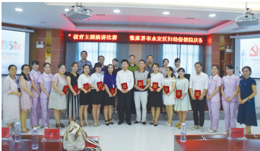
结合医院特点，创建党建品牌