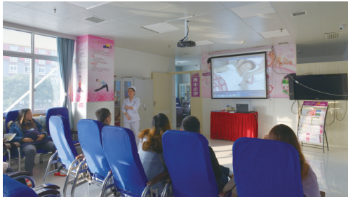
医院开设的孕妇学校