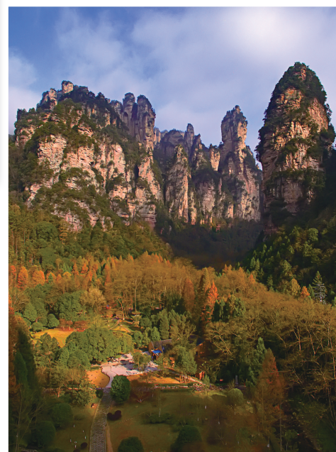
公园秋色