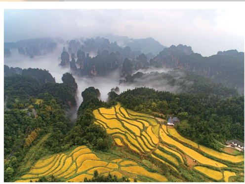
仙山田园