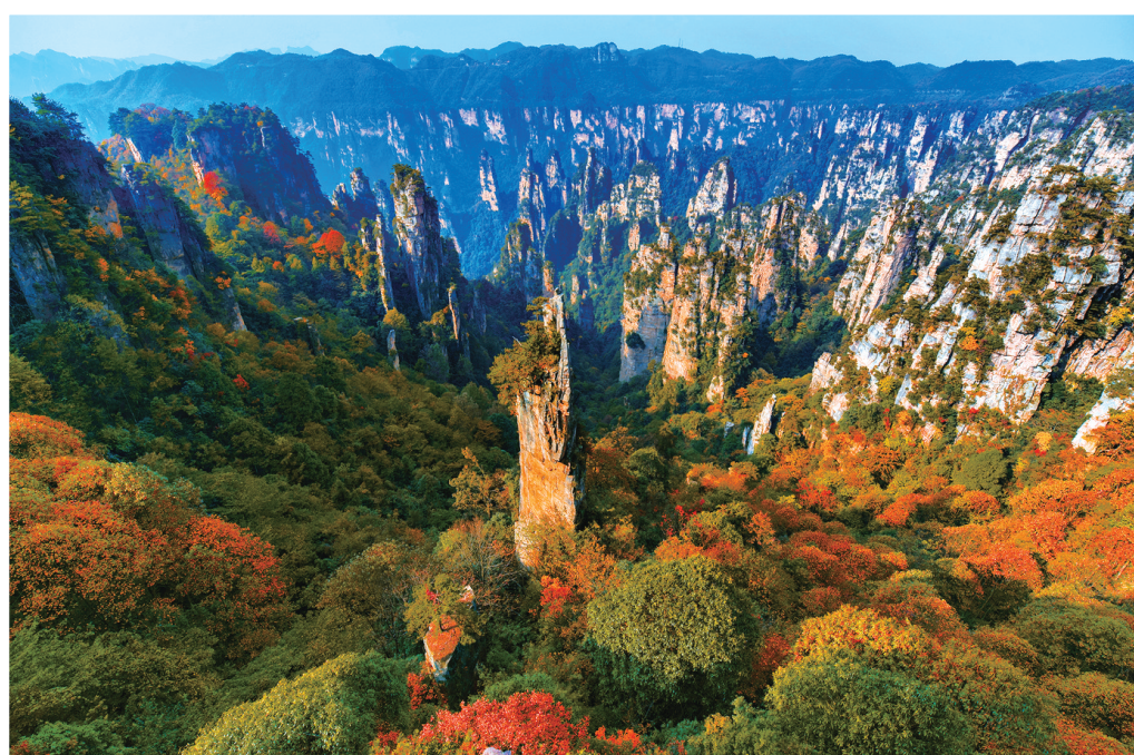
芙蓉生花