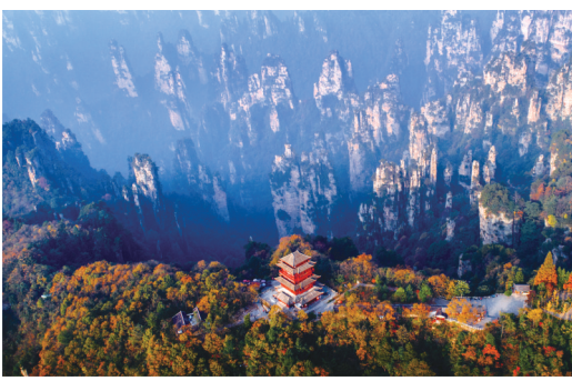
天子阁秋色