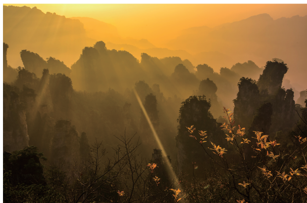
曙光初照