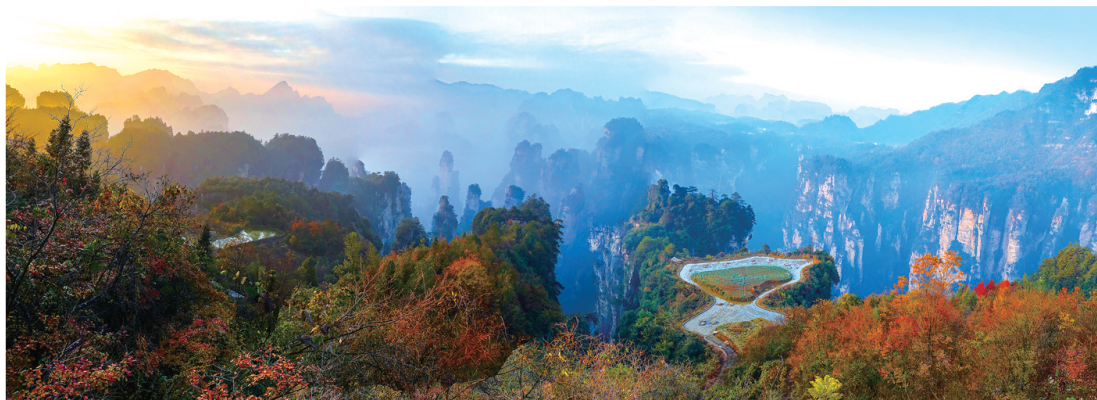
迎晖 龙雁 摄