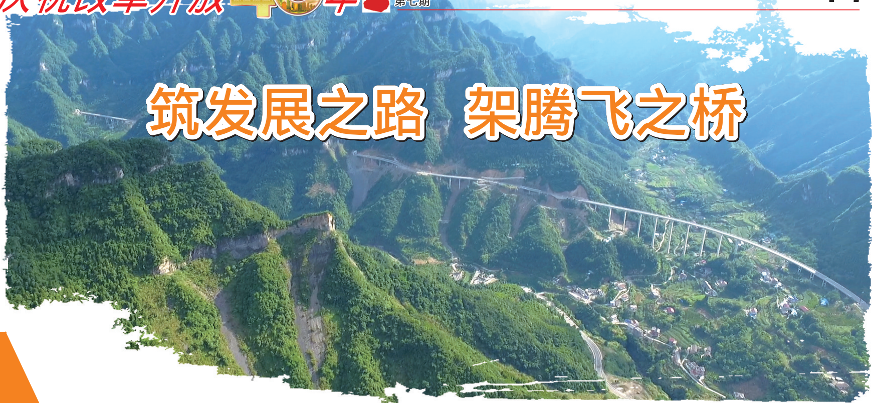
邢大公路。