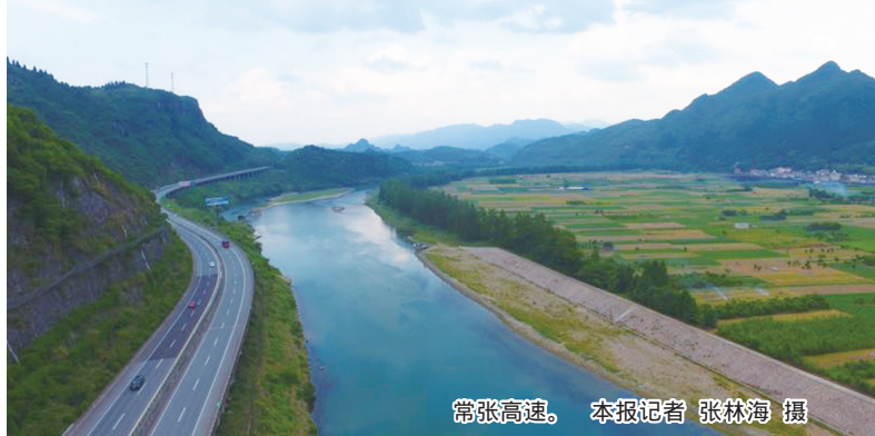
常张高速。