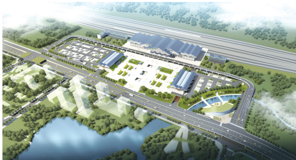
张家界综合客运枢纽

市交投集团自成立以来，就以“投资筑精品项目、增进民生福祉”为己任，立足促进张家界经济社会发展，加快推进全市交通基础设施建设。如今，十五岁的交投作为张家界交通基础设施投融资建设的主力军，正以昂扬的姿态在经济建设的大潮中踔厉前行。截至目前，市交投集团已建成十个重大民生项目，正在积极推进四个重点项目。行于此，不止于此，市交投集团将继续“撸起袖子加油干”，在全市大发展的卷帙中书写华章。