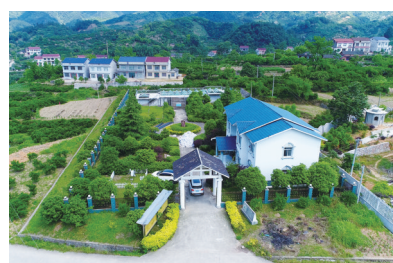
苗市水厂