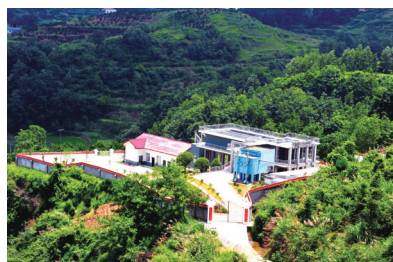
岩泊渡水厂

在新的历史起点上，慈利县水利局将奋力推进水利改革发展新跨越，让江河更加安澜、山川更加秀美、人民更加安康，为努力实现经济强县梦、全面小康梦、撤县设市梦提供更加坚实的水利支撑和保障！