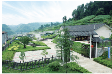
阳和水厂