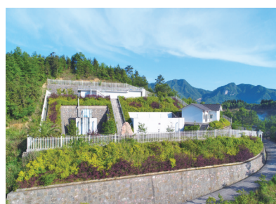
零溪水厂